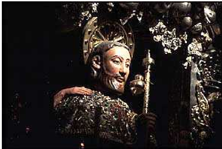
Catedral de Santiago de Compostela (Busto del Apostol)

en las poblaciones por las que se peregrinaba, las indicaciones calle del Camino e iglesia de Santiago , que marcaban el recorrido medieval.