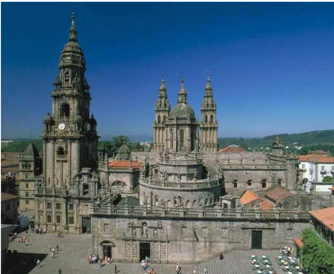
Catedral de Santiago de Compostela (Puerta del Perdón)

"La puerta se abre a todos, enfermos y sanos; no sólo a católicos, sino aún a paganos, a judíos, herejes, ociosos y vanos; y más brevemente, a buenos y profanos".