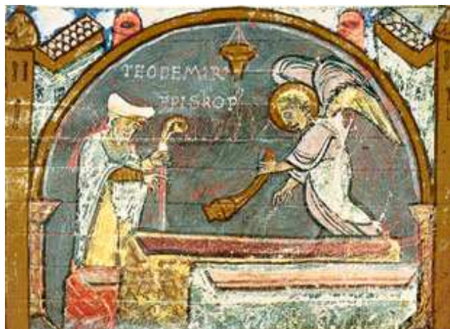
Descubrimiento del sepulcro de Santiago

Ocho siglos después de la muerte del Apóstol, en el año 813, siendo rey de Asturias Alfonso II el Casto y emperador de Occidente, Carlomagno, ocurrió lo siguiente: Un ermitaño llamado Pelagio o Pelayo, vio una estrella posada en el bosque Libredón. Se lo comunicó al obispo Teodomiro, obispo de Iria Flavia. Fueron allí y descubrieron en la espesura la antigua capilla. Alfonso II viajó con su corte al lugar, convirtiéndose así en el primer peregrino de la Historia. Mandó edificar una pequeña iglesia. La noticia se propagó rápidamente. Santiago, tan invocado en el siglo VIII, se manifestaba al fin con la revelación de su sepulcro.