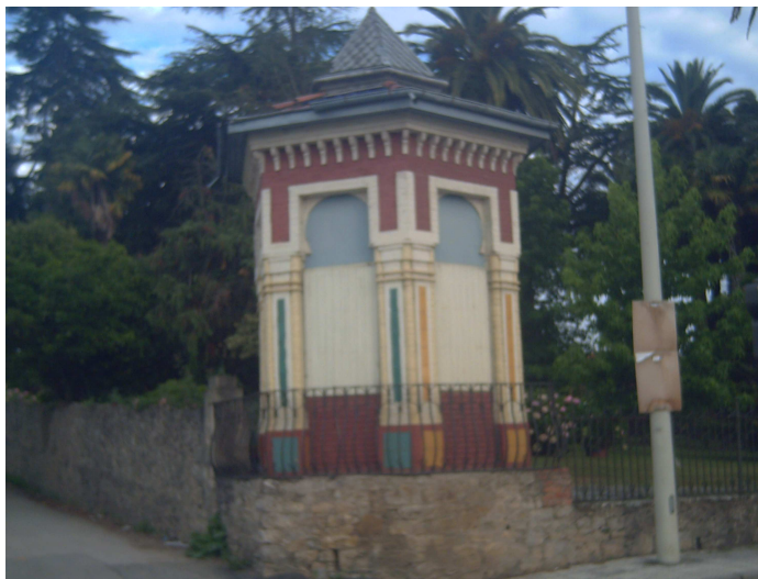
Templete a la salida de Treto

El trecho de Colindres a Treto no plantea ninguna dificultad, es prácticamente llano y como la temperatura ayuda resulta un paseo bastante agradable. No hay circulación de vehículos y por las casas que se encuentran a los laterales apenas hay movimiento, por lo que la tranquilidad solo se ve interrumpida por cantos de pájaros. Para continuar hacia Cicero hay una desviación a la derecha en dirección a Santoña, pero a unos 300/400 metros una pista cementada a la izquierda conduce al Barrio de Cicero, que es la antesala del propio Cicero, el cual está muy próximo.