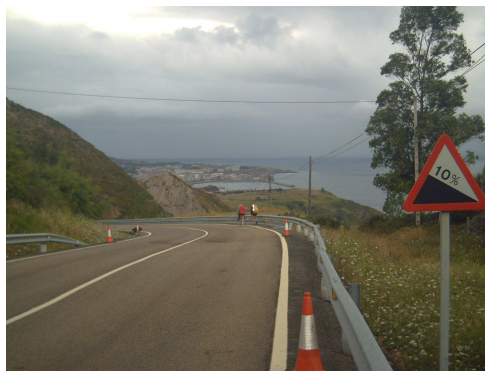
También se camina cuesta abajo

Así que siguiendo este sendero y dejando Covarón a nuestra izquierda llegamos a Ontón. Aquí decidimos no hacer la ruta del monte, sino seguir por la carretera N 634, que aunque antiguamente tenía bastante tráfico, hoy día al haberse retirado este hacia la autopista, hacen este camino bastante aceptable. Como empieza a llover, paramos un momento para proteger las mochilas del agua, aunque no nos ponemos toda la ropa de agua pues parece solo una llovizna.