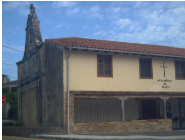
Ermita Nª Sª de Gracia (Gama)

El camino hacia Gama se inicia por una pista de cemento que se continúa por una pista de tierra, que discurre muy próxima a la autovía hasta finalizar en el Barrio "La Bodega", en el camino se encuentra una ermita dedicada a Nuestra Señora de Gracia y tras pasar por un barrio tipo residencial se llega a Gama.