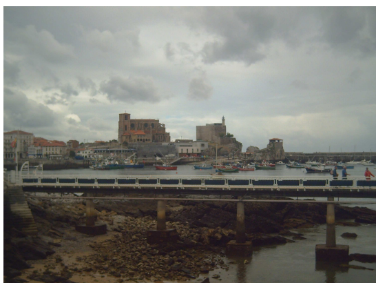
Puerto de Castro Urdiales