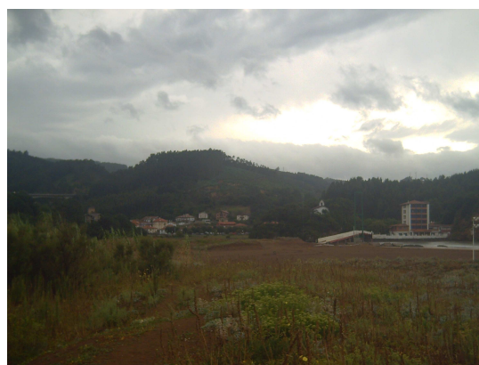
Al fondo Pobeña

Cuando me encontraba de camino, todavía en el casco urbano, empezó a llover, primero un aguacero de tormenta que me obligó a guarecerme bajo una marquesina de una parada de autobús. Como la lluvia no cesaba, aunque disminuyo en su intensidad, me puse la ropa de agua y me dispuse a afrontar los próximos kilómetros bajo la lluvia.