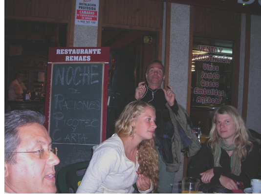
Cena al aire libre

Nos volvimos a reunir todo el grupo en el albergue, pues habíamos quedado para cenar todos juntos, lo que hicimos al aire libre a base de tapas en un restaurante cercano. De allí nos acercamos al festival folclórico, que se celebraba en un parque cercano, vimos algunas actuaciones, recorrimos los diversos puestos de artesanía y después de tomarnos dos botellas de sidra nos fuimos al albergue y nos dispusimos a dormir.