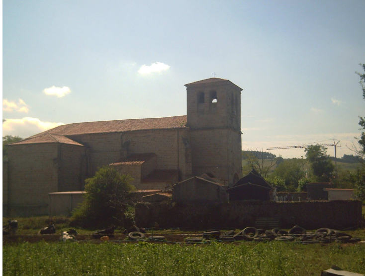
Castillo, iglesia, cementerio, “cementerio de neumáticos”

El paso por Castillo lo realicé sin novedad, como cosa curiosa es importante reseñar que en este pueblo existe un centro de tradiciones rurales, donde se recoge el saber los oficios y las tradiciones de toda esta zona, muchas de ellas en desuso o desaparecidas. Después al rodear la iglesia, mi visión tomó en cuenta el contraste de la iglesia junto al cementerio del pueblo y un cementerio de la nueva tecnología (neumáticos).