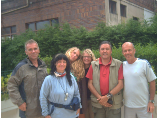
Grupo en terraza de Somo