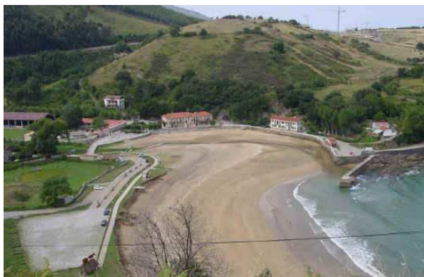
Playa de Mioño