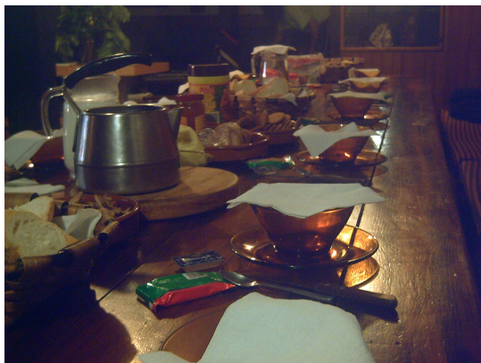
Desayuno del albergue