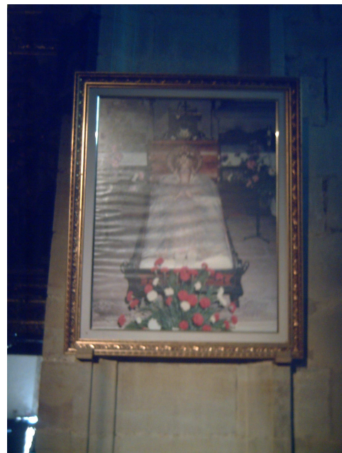
Cuadro Virgen de la Cama