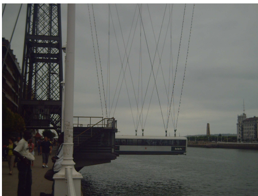
Barquilla del puente colgante

Si antes comentaba la imagen de la decadencia, esta se acrecienta cuando se llega a Sestao, la que en otro tiempo fuera una ciudad donde habitaban gran cantidad de los trabajadores de las Industrias de Bilbao, la zona por donde pasa el Camino ha dejado de ser esa zona de casas de trabajadores para en su lugar alojar a nuevos habitantes y se ha convertido en lo que se pudiera llamar una “zona marginal”