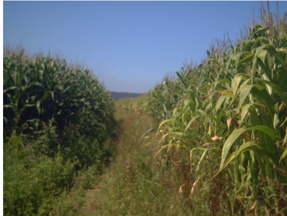
Entre los muros de maíz

De Castillo a Meruelo el camino se alterna con pasos diversos, sobre un puente, sobre praderas e incluso pasa entre un campo de maíz, lo que le da un cierto contraste y menos monotonía. Cuando se llega a Bareyo, lo mas importante del Camino es detenerse y disfrutar de la magnífica iglesia románica de Santa María. El problema es que dado la hora esta está cerrada y solo se puede admirar por fuera, no obstante a mi no me importó mucho, pues como estaré dentro de unos días en Somo, puedo acercarme con el coche y visitarla detenidamente, así que prácticamente sin detenerme inicio el último tramo de esta etapa, donde ya empiezan a pesar las piernas.