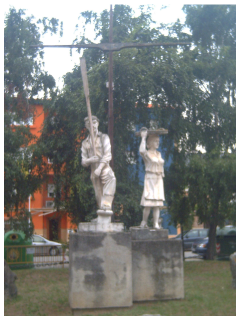
Monumento al pescador y la panchonera