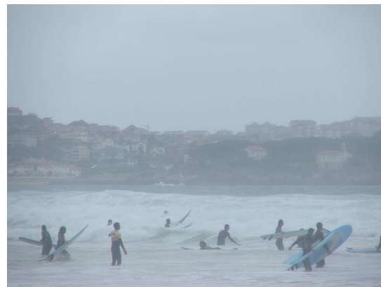
Surfistas en la playa de Somo