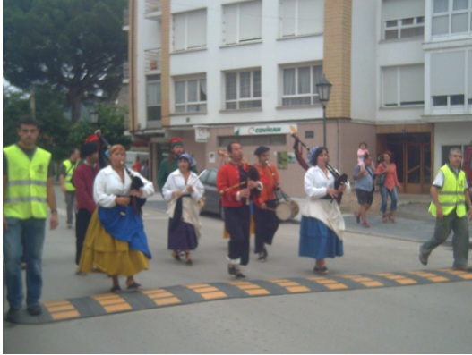
Banda de gaiteros por la calle