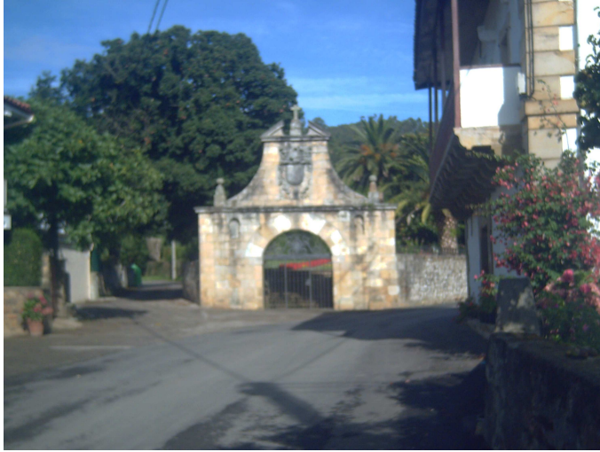
Calle de Liendo