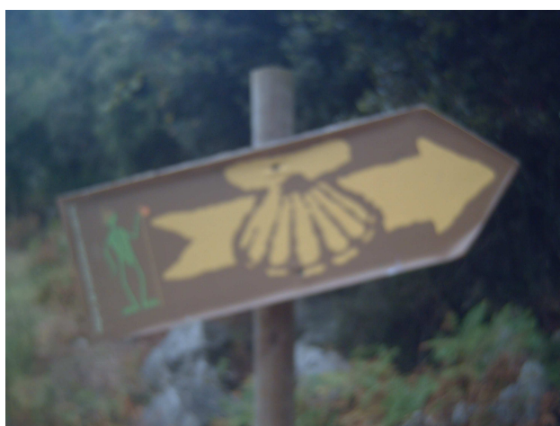
Indicador del Camino y la senda verde

Así que esta fue mi experiencia en Allendagua, donde la tradición cuenta que hubo un castillo de los templarios. Después de pasar por Cerdigo, con bastantes zonas de chalets clónicos que afean el entorno, antes de llegar a Islares, el camino transcurre conjuntamente con una vía verde por la que se llega hasta el mar, en la que me encuentro a algunos jóvenes excursionistas.