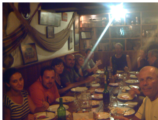
Cena en el albergue