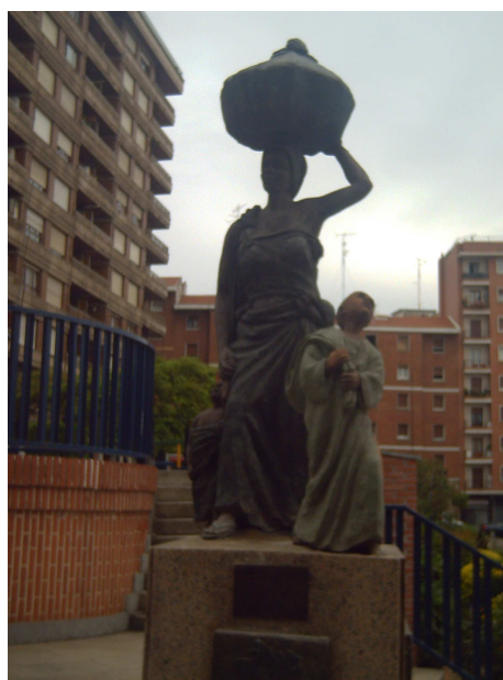
Monumento a la Sardinera

Hablo con el hospitalero y le indico que no voy a quedarme, que quiero seguir hacia Pobeña, pero que voy a dejar la mochila mientras me voy a comer algo. Me sella la credencial y me indica un lugar para come (Taberna Normanda, en la calle Guipúzcoa nº 20), donde han llegado a un acuerdo con el albergue para que a los peregrinos les cobre 8 € por el menú del día y aunque están en fiestas a los peregrinos les respeta este acuerdo. Así que allí me dirijo, subiendo por las rampas mecánicas y pasando por el monumento que recuerda a las antiguas sardineras que como dice la canción “iban por toda la orilla” para llevar su mercancía a Bilbao.