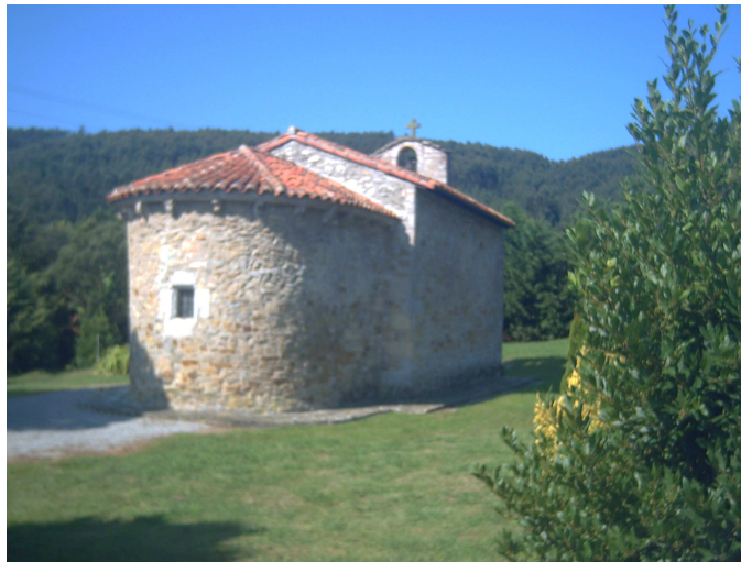
Ermita románica camino de Castillo

Me enseña un montón de tiestos con plantas que cuida en el atrio posterior, para que siempre luzcan bien, la pila de bautismo, que está engalanada, pues luego habrá uno y lo mas curioso, un cuadro de la Virgen de la Cama. Una virgen acostada en la cama que se venera en el monasterio de Clarisas que se encuentra al otro lado de la carretera, que es una imagen milagrosa que salvó al pueblo de la peste y que la sacan en procesión el día 22 de agosto, que es el día que se la puede ver, pues las monjas son de clausura.