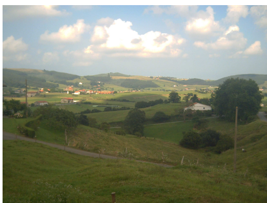
Vista desde el albergue

Volviendo otra vez al mundo profano, la tarde fue estupenda, el ambiente da para hablar mucho y allí nos fuimos conociendo cada vez mas y forjando esos lazos que te atan. A mi especialmente me han atado al albergue de Guemes. Valía la pena hacer el Camino para llegar hasta aquí, Por suerte varias veces he tenido ambientes similares aunque no tan completos) en otros albergues y eso te compensa de los que solo son “salas de descanso”.