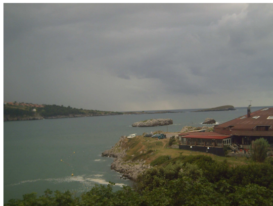
Camping de Islares

Al poco rato y tras pasar bajo un alto puente de la autopista llego al bar de El Pontarrón, donde tengo que inscribirme y sellar la credencial. Allí me indican donde está el albergue al que llego y ocupo la última litera que queda libre.