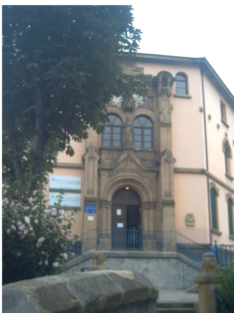
Albergue de Portugalete

La siguiente sorpresa me la llevé cuando en dirección al albergue me encuentro unas rampas mecánicas que para solucionar la subida de la calle en cuesta, también te llevan hasta el albergue, así que es la segunda vez que en el Camino de Santiago, se nota la aplicación tecnológica (ascensor en Deba y rampas aquí). En fin que llego al albergue, que se encuentra en un centro de educación de la calle Casilda Iturrizar, que aunque son las tres de la tarde ya está abierto y tiene peregrinos alojados.