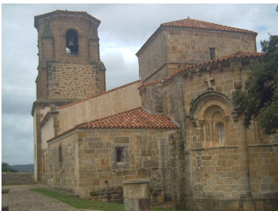
Santa María de Bareyo

vaso de agua fresca. Allí me dicen de “cachondeo”, que cuando llegue al albergue tenga cuidado de no electrocutarme en la ducha, pues dicen que las obras que se hacen en el albergue no son nada seguras. Yo “pasé olímpicamente” del tema y tras agradecerles el agua seguí mi camino,