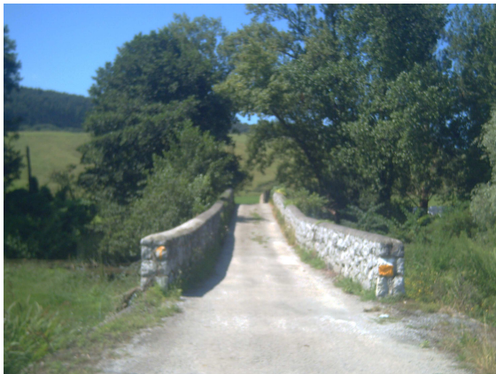
Entre los muros del puente

El paso por Castillo lo realicé sin novedad, como cosa curiosa es importante reseñar que en este pueblo existe un centro de tradiciones rurales, donde se recoge el saber los oficios y las tradiciones de toda esta zona, muchas de ellas en desuso o desaparecidas. Después al rodear la iglesia, mi visión tomó en cuenta el contraste de la iglesia junto al cementerio del pueblo y un cementerio de la nueva tecnología (neumáticos).