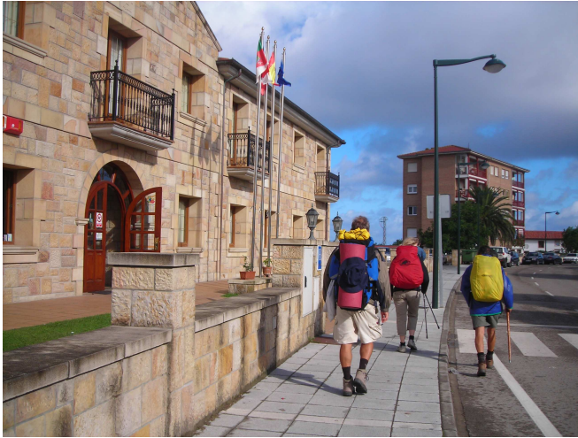
Caminando por Galizano