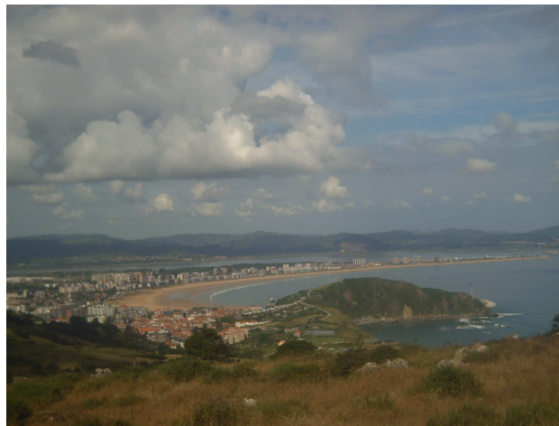
Laredo desde el monte

Después de despedirnos del lugareño, el excursionista (que estaba bastante grueso), se desvió hacia la carretera y yo seguí por el borde del acantilado hasta llegar a la cima, donde hay una vieja casona parcialmente derruida.