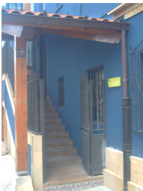
Entrada al albergue de Colindres