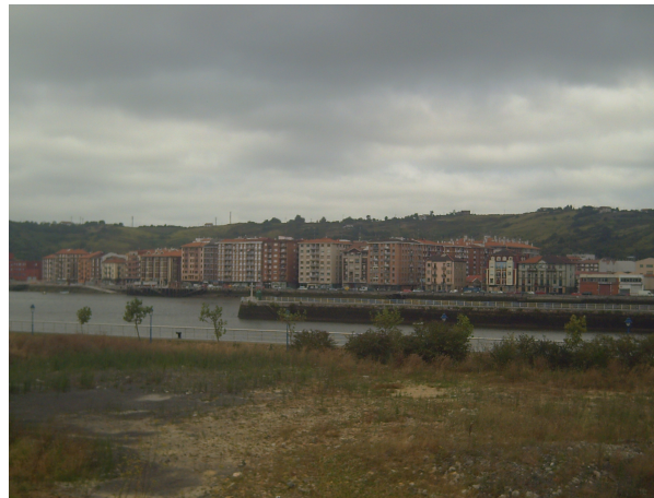
Baracaldo (crucero en la ría)

Tras superar algunas dificultades, pasar las vías del tren por una pasarela, llegué a una gasolinera desde donde accedí a la carretera y pude continuar. Ahora ya el tráfico era mas intenso y el camino tenía los inconvenientes de circular por carretera. Me llamo la atención la estación de FEVE de Luchana, como una estampa del pasado, cuando la circulación de los trenes de vía estrecha era fundamental para transportar el carbón desde La Robla hasta los altos hornos de Bilbao. En general todo el paseo por la ría, como este tramo paralelo te da la sensación amarga de la decadencia industrial de esta zona.