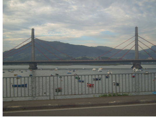
Puente sobre la ría de Treto

El trecho de Colindres a Treto no plantea ninguna dificultad, es prácticamente llano y como la temperatura ayuda resulta un paseo bastante agradable. No hay circulación de vehículos y por las casas que se encuentran a los laterales apenas hay movimiento, por lo que la tranquilidad solo se ve interrumpida por cantos de pájaros. Para continuar hacia Cicero hay una desviación a la derecha en dirección a Santoña, pero a unos 300/400 metros una pista cementada a la izquierda conduce al Barrio de Cicero, que es la antesala del propio Cicero, el cual está muy próximo.