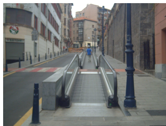
Subida mecanizada al albergue