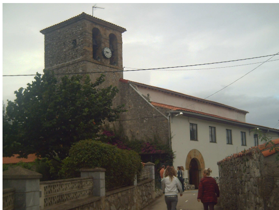
Iglesia de Islares