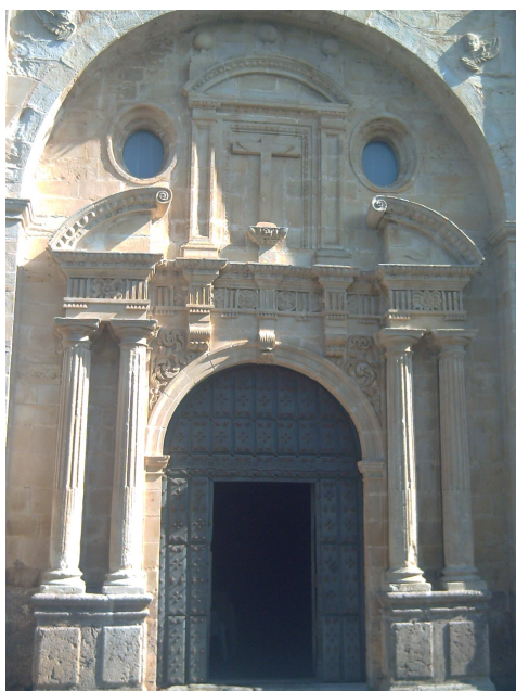
Escalante iglesia de La Cruz

De Gama a Escalante el camino se hace corto, pues están muy próximos el uno del otro y como el piso es llano y sin incidentes, resulta un agradable paseo, aunque parte es paralelo a la carretera de Santoña, que enseguida por un desvío se llega a Escalante. Allí paro a comer algo, un pincho de tortilla y una cerveza y aprovecho para satisfacer otras necesidades. La dueña del bar me indica que tenga cuidado con la carretera que lleva a Castillo, pues hay tramos con curvas y poca visibilidad, tanto para los coches como para los peatones. Le agradezco sus indicaciones y cuando salgo veo venir por la acera de enfrente un peregrino que no conozco, que me hace un saludo desde lejos