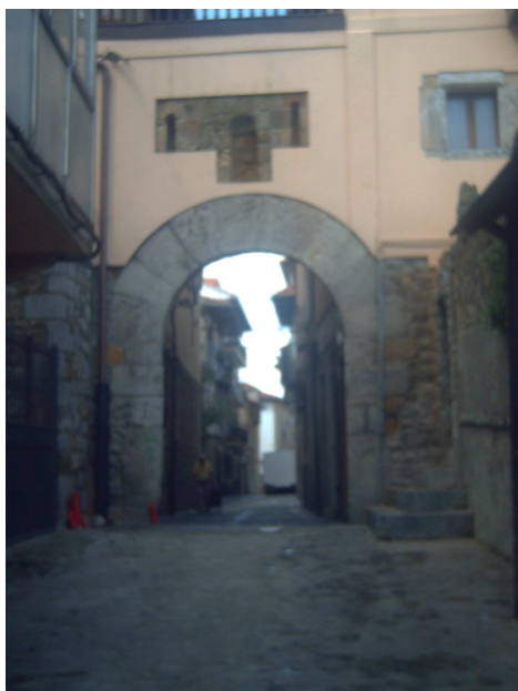
Antigua puerta de la muralla

Desde allí ya se divisa Laredo, pero para llegar hay que bajar una ladera con pradera y piedras que se usa para que pasten caballos, teniendo bastante cuidado en las piedras y en “otras cosas mas blandas” que puedes pisar, llegas a una carretera vecinal que desemboca directamente en la parte vieja de Laredo.