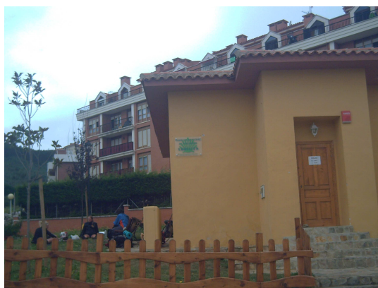
Albergue de Castro Urdiales