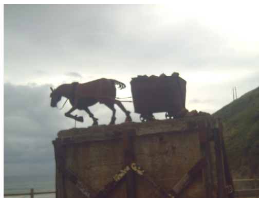
Monumento al caballo minero