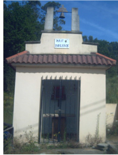
Ermita de San Julián

Un poco mas adelante, el camino de la playa sigue de frente y yo debo tomar el de la izquierda, un camino de piedras sueltas que asciende por el monte, frente a un farallón con aves rapaces y paralelo al acantilado, allí me encuentro sentado en unas piedras al matrimonio de holandeses, que al parecer conocían esta ruta, estaban almorzando (eso era lo que llevaban en las bolsas de plástico) y me saludaron al pasar.