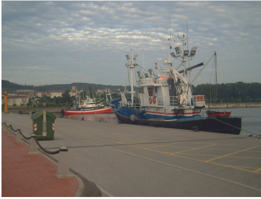
Puerto de Colindres