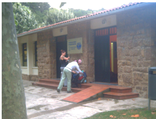
Preparando la marcha ante el albergue

Parece que a las siete de la mañana tocasen “diana”, pues empezamos a levantarnos prácticamente todos, lo que acarrea esperas para el aseo y los servicios, pero poco a poco todos fuimos preparándonos.