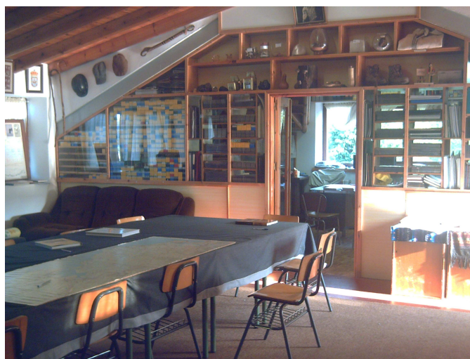
Parte de las “salas del tesoro”