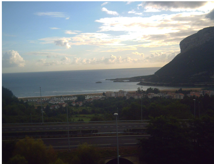
Playa a la salida de Gurriezo