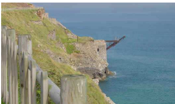
Restos del antiguo cargador de mineral

Siguiendo las señales, cruzamos la plazoleta e iniciamos el ascenso al monte por una larga escalinata (no está mal para iniciar el día), pero pronto las vistas reconfortan, pues empezamos a recorrer una "Vía verde", que sustituye a una antigua vía del ferrocarril minero que daba servicio al cargadero de la Arena, donde observamos algunos restos de esta actividad. y además, se ha convertido en un recurso didáctico, pues a lo largo de esta "Vía Verde" se han instalado distintos paneles informativos sobre flora, fauna, geología, agricultura y los recursos y valores de esta zona que, podemos ir observando.