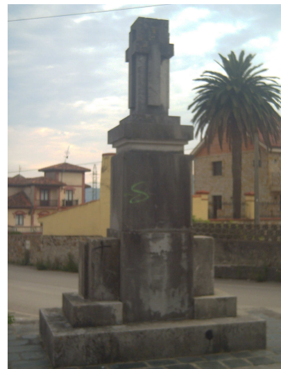
Crucero en Cicero

En Cicero, es curioso observar la iglesia realizada en piedra lo que le da un aspecto de fortaleza y tiene un reloj de sol encima del pórtico de entrada. Siguiendo la carretera se llega junto a un curioso crucero, allí me encuentro con dos hombres que se dirigen a realizar labores en el campo y me preguntan que hasta donde voy, les indico mi ruta y me comentan que al llegar a Escalante puedo ir directamente a Castillo sin pasar por Noja, pues existe una carretera que los une directamente y se ahorran algunos km. además tiene bastante arbolado y buenas vistas a los valles, pero hay que tener cuidado con el tráfico, pues casi no hay arcén. Me despido de ellos agradeciéndoles la información, que comprobaré cuando llegue allí.