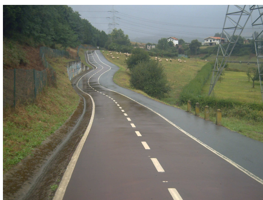
Carril hacia Muskiz

Agradecí al hospitalero sus indicaciones y entonces vi como entregaba a un peregrino unas sábanas desechables, creo que es el único albergue público donde hacen esto. Salí del albergue y volví a subir por las rampas mecánicas en dirección a la pista para bicicletas y caminantes que termina en Muskiz (antiguamente Somorrostro), donde se encuentra la playa Las Arenas.