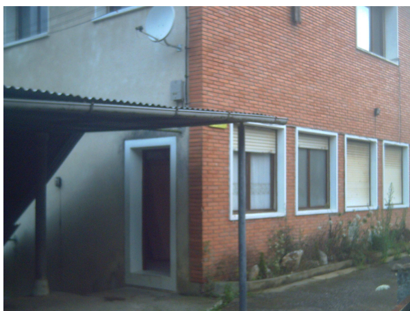
Albergue de El Pontarrón