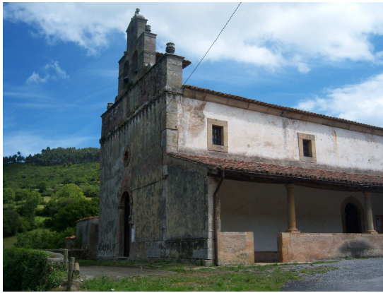
San Pedro en Pernús