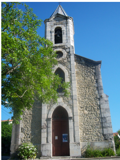
Iglesia de Santa Marina

Salté hacia la cuneta y de nuevo por el arcén de la carretera seguí caminando hasta que casi dos km mas adelante encontré lo que era la salida del camino del monte ahora inutilizado y continuando la marcha llego hasta Buelna, donde doy una vuelta por el pueblo, pues aunque no tiene grandes monumentos, su conjunto resulta muy armónico, hay dos antiguas ermitas reconvertidas e integradas en casas particulares y la iglesia de Santa Marina, que aunque como monumento no sea muy valorada, sobresale y preside todo el conjunto.