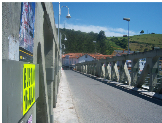
Puente hacia Bustio

La comida no estuvo mal, pues un buen plato de paella y otro de bonito con tomate, junto con postre y café, hacen milagros. Salimos del restaurante en dirección al puente que separa Unquera de Bustio, y en la terraza de una cafetería encontramos a la pareja de Zaragoza que estaban tomando café y vimos como llegaba Patrik.