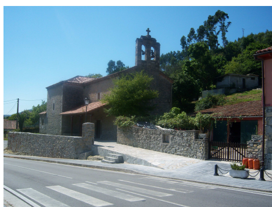
Iglesia en La Acebosa

Por caminos y antiguas carreteras prácticamente sin tráfico y atravesando la pequeña población de Hortigal, se llega a Estrada, donde sin apenas desvío se pasa por delante de una ermita y una fortaleza en forma de torre, que por el aspecto deben tener usos culturales. Junto a ellas una casa rural da vida al conjunto, pues es el único lugar donde se aprecia movimiento.