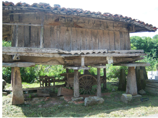
Hórreo con carro

La carretera sigue con la misma tónica, salvo que volvemos a ascender hasta llegar a La Llera donde una iglesia (San Antolín) similar a la anterior es la construcción que destaca de este pequeño conjunto de casas, lo mismo que un antiguo hórreo, en el que resguardado bajo el se aprecia un antiguo carro tradicional. Aunque se nota que está fuera de uso, el conjunto resulta muy pintoresco. Desde allí hasta Priesca, donde teníamos cierto interés por llegar, pues se encuentra una pequeña joya del prerrománico de Asturias, la iglesia de San Salvador, el camino se nos hizo bastante corto.