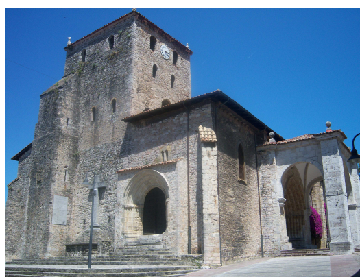
Iglesia de Santa María del Conceyu