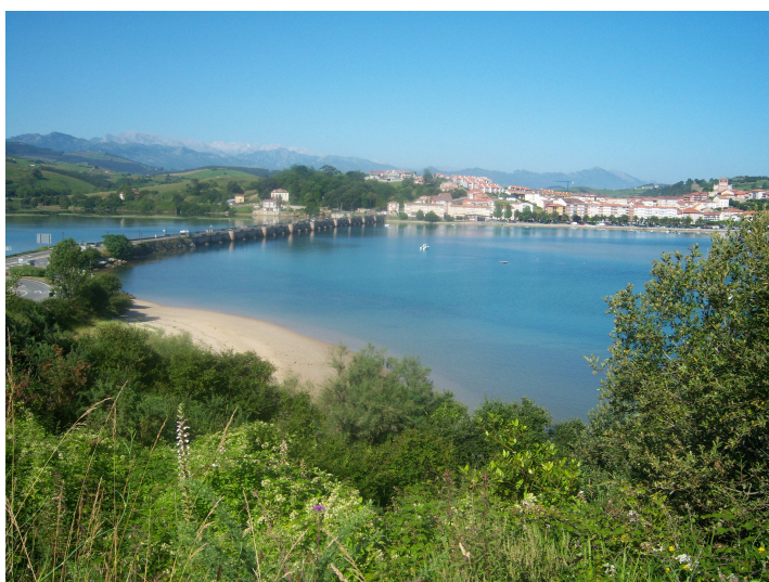
Llegando a San Vicente

Poco a poco se va notando la llegada a San Vicente, pues hacia la izquierda, se adivina la carretera y algo mas allá la autovía, así que casi de repente llega la primera vista de