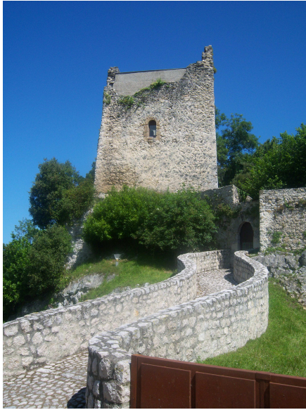
Torre de La Estrada