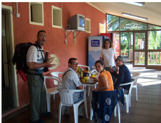
Desayuno en el camping

La llegada a Berbes se hace sin novedad y como no se entra en el pueblo te conformas con apreciar los contrastes desde la carretera, donde se suceden las construcciones tradicionales con las de nuevas líneas y coloridos. Seguimos en ruta y alternando camino y carretera llegamos a una pista que asciende entre eucaliptos y bastante vegetación de la que casi no vemos su inicio, pues alguien ha destrozado el panel informativo, donde seguramente estuviera pintada una flecha amarilla y actualmente hay una realizada con piedras por algún peregrino, que si no estás atento puede pasar desapercibida. Al poco rato de caminar descendemos y salimos de la vegetación directamente al Arenal de Moris, una bella playa solitaria donde nos recreamos la vista. Como nos apetece tomar algo, parte del grupo que se había adelantado nos informa que hay un camping, donde se puede desayunar, así que allí nos dirigimos para reponer fuerzas.