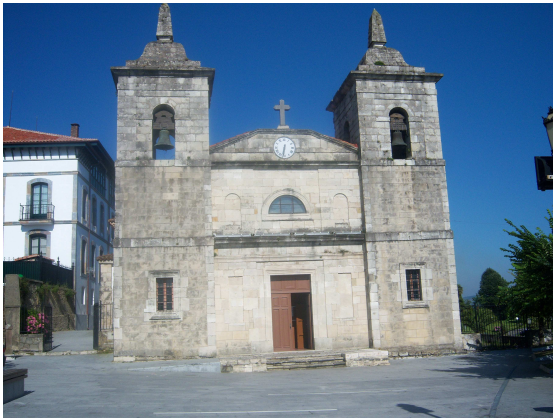
Iglesia de Santa María

En este caso, la comodidad del alojamiento se agradece, pero te priva del contacto con otros peregrinos, que es uno de los mayores encantos del Camino. Por eso tras el aseo, una ligera colada que puse a secar en la terraza, salí a conocer el lugar. En primer lugar y dominando la plaza estaba la iglesia de Santa María, con un estilo que parece también traído de América. En un rincón de la plaza había un kiosko de turismo y me acerqué a pedir información. Al ver que era peregrino, me comentó que acababan de llegar unos peregrinos y les habían alojado en el polideportivo municipal. Me recomendó visitar el Museo de la Emigración de la Fundación Archivo de Indianos (Quinta Guadalupe), que se encontraba allí al lado, en el centro de un parque.