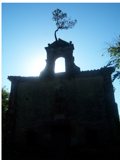
Golf Santa Marina

La urbanización del campo de golf, continúa durante un trecho mas, pues todo el camino que conduce a su entrada esta bordeado con farolas y pequeñas aceras, aunque bastante compatibles con el entorno, hasta que termina en una pequeña rotonda donde hay carteles indicativos para de la entrada al campo y en lo que debió ser una ermita ahora hay un restaurante, el camino continúa en dirección a La Revilla, aunque no pasa por el pueblo.