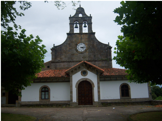
Iglesia de San Esteban