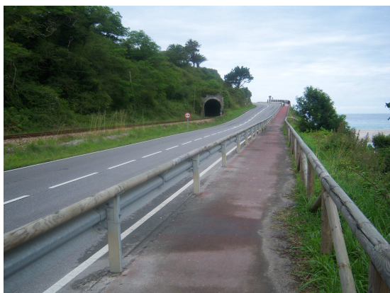
Camino de hierro, de asfalto y a pie

Fue San Antolín parroquia del barrio de su nombre y de el de San Martín, y de los pueblos de Rales y Naves, hasta que el año de 1803 se declaró a Rales vicaria independiente, quedando en Naves la parroquialidad del mismo pueblo y barrios de San Martín y San Antolín, a donde se trasladó definitivamente en el año de 1808. Quedando San Antolín abandonado hasta la actualidad.