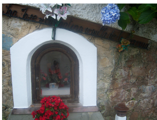
Capilla de San José

Desde aquí caminamos juntos y con el español que ella sabe y el “chapurreo” típico del camino vamos cambiando impresiones. Llegamos a Nueva y aparece el ciclista italiano al que le comento que su compañero va por delante y que le esperará en Ribadesella. Se despide de nosotros y seguimos caminando por el arcén hasta que llegamos a la iglesia de San Pedro.