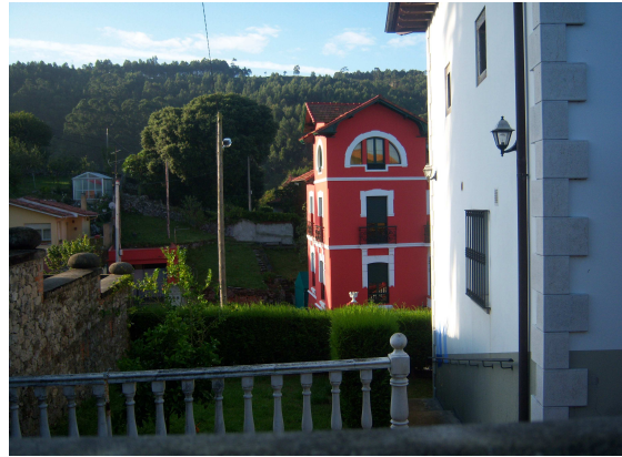
Berbes (contraste de construcciones y colorido)

La llegada a Berbes se hace sin novedad y como no se entra en el pueblo te conformas con apreciar los contrastes desde la carretera, donde se suceden las construcciones tradicionales con las de nuevas líneas y coloridos. Seguimos en ruta y alternando camino y carretera llegamos a una pista que asciende entre eucaliptos y bastante vegetación de la que casi no vemos su inicio, pues alguien ha destrozado el panel informativo, donde seguramente estuviera pintada una flecha amarilla y actualmente hay una realizada con piedras por algún peregrino, que si no estás atento puede pasar desapercibida. Al poco rato de caminar descendemos y salimos de la vegetación directamente al Arenal de Moris, una bella playa solitaria donde nos recreamos la vista. Como nos apetece tomar algo, parte del grupo que se había adelantado nos informa que hay un camping, donde se puede desayunar, así que allí nos dirigimos para reponer fuerzas.