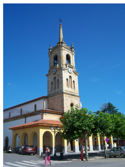
Colunga (Ermita de N a S a de Loreto e iglesia de San Cristóbal)