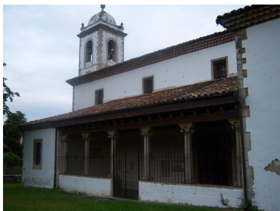
Iglesia de Poo

Dentro de esas curiosidades que te encuentras en el Camino, llamó mi atención el muro de una construcción rural donde encuentro una triple señal como confluencia de tres rutas, la Vía Jacobea, la ruta que por Asturias te lleva a “La Santina” (Covadonga) y la ruta de excursionismo GR-E-9. Así que intereses culturales y religiosos hay momentos en que conviven.