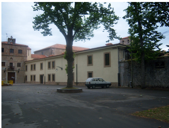
Celorio (Casa de ejercicios)

El siguiente punto de paso es Celorio, donde la casa de ejercicios y la iglesia forman un conjunto inconfundible. Me saluda una pareja de la Guardia Civil que van en un todo terreno y me desean buen camino, mientras dejo Celorio camino de Barro que se adivina a lo lejos por la senda que bordea la costa