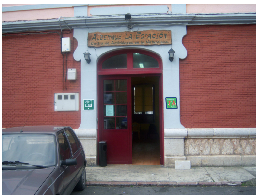
Albergue “La Estación”