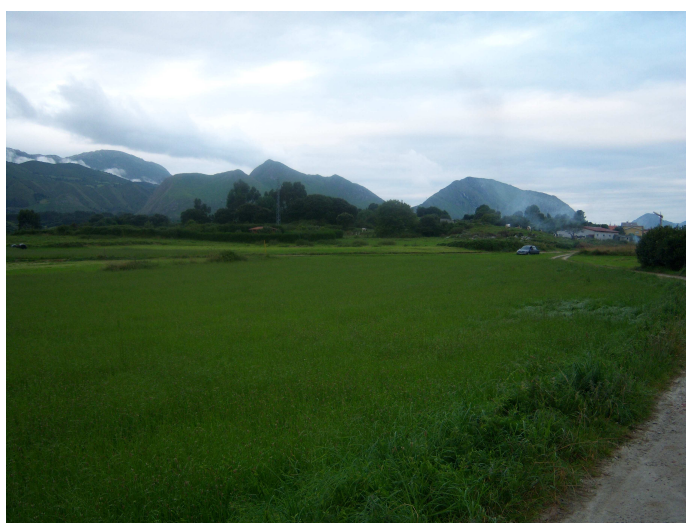
Entre campos y montañas

Después de esta charla y de un desayuno completo, terminé de preparar mis bártulos, me despedí de mis compañeros, pues ellos iban mas lentos y salí del albergue para enseguida ponerme en ruta siguiendo la carretera general, hasta que a la salida del pueblo, cuando aún no se habían terminado las farolas, la señalización del Camino me hace tomar una antigua carretera que tras cruzar las vías del tren se trasforma en un camino rural, en el que me rodean prados y algunos cultivos, pero todo ello presidido por las montañas que siempre al frente o a la izquierda dominan el paisaje.