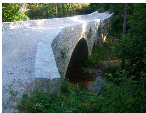
Puente sobre el río Cabra

No obstante, como según la información que tengo esta etapa transcurre muchos km por la carretera, hay que aprovechar estos momentos. Cruzo el río Cabra por un puente que parece recientemente reformado y al poco rato, dejo pasar a un ciclista, no es peregrino, es de los que hacen travesías por el monte. El camino se estrecha un poco y se acerca a la carretera, tanto que en una flecha amarilla poco marcada, te indica salir a la cuneta, no le doy importancia y sigo por el camino en un ligero ascenso.