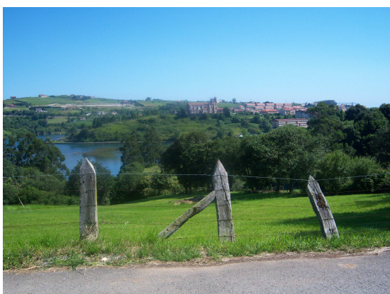
Otra vista de San Vicente

Como la estación tiene cafetería decido parar allí para reponer fuerzas. Dejo la mochila, utilizo los servicios y con un “Aquarius” y un bocadito de jamón, repongo fuerzas para continuar. Antes de salir llega la peregrina danesa que me saluda y me pide que le cuide la mochila hasta que vuelva del servicio. Cuando vuelve nos despedimos y salgo para continuar con la “subidita” hasta el alto de Santiago, por donde continúa el camino, esta es una parte de San Vicente que no conocía y desde luego no es para pasearla a pie, eso sí cuando llegas tienes una visión totalmente diferente del pueblo, que no figura en ninguna de las vistas turísticas habituales. De aquí a La Acebosa (que está considerado como un barrio mas y en el que está la casa natal del cantante Bustamante) el camino no tiene desnivel.