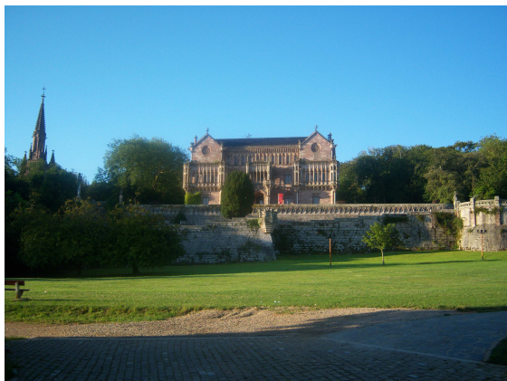
Salida de Comillas

Poco a poco fuimos saliendo del albergue, los primeros y con “mucha marcha” fueron los de Zaragoza después Patrik y yo, aunque poco duramos juntos, pues como el no había visto “El Capricho de Gaudí” decidió esperar a que abrieran ya que como le sucedió con Altamira quiere aprovechar su estancia en España para empaparse todo lo que pueda de su cultura y monumentos. Así que en solitario deje Comillas para continuar mi Camino.