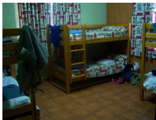
Dormitorio del albergue

Atravesando por las calles del centro, seguimos una avenida con árboles y enseguida nos recibieron en el albergue, nos sellaron las credenciales y rellenamos la ficha correspondiente, pues este es un albergue del servicio de turismo de Asturias, aunque sea utilizado también como albergue del Camino. Nos asignaron una habitación con tres literas y vistas al andén de la estación, muy bien cuidada y con armarios que se pueden cerrar con llave.