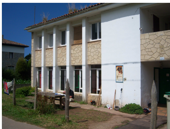
Albergue de Sebrayo