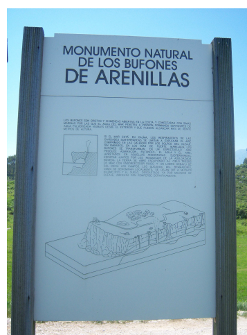
Los bufones de Arenillas