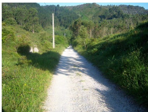
Camino por monte

Este trayecto por la carretera continúa hasta que se pasa por La Franca. Después un mojón señala el inicio de un camino por el monte, que te devuelve a los ruidos de la naturaleza, aunque a lo lejos se adivina la carretera y cuando el camino se aproxima, enseguida se nota.