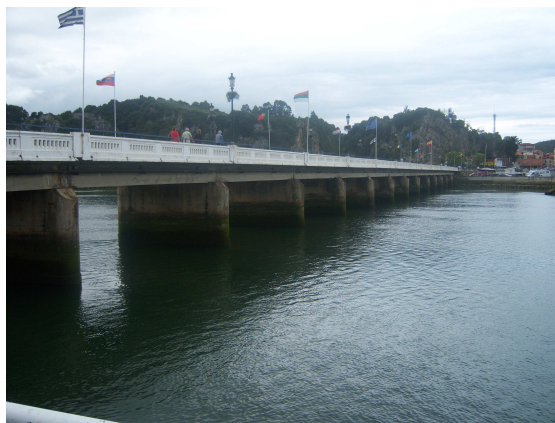
Puente sobre el Sella