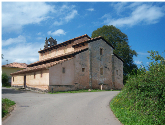
San Salvador de Priesca

Al llegar lo primero que hicimos fue beber unos tragos de agua fresca que nos ofrecieron en la primera casa que se encuentra frente a San Salvador, además es donde están depositadas las llaves para poder visitarla. Nosotros solo pudimos verla por fuera y contemplar las curiosas ventanas del ábside y de los laterales, ya que la persona que dejaba las llaves no se encontraba en el pueblo y la que allí estaba no quiso asumir la responsabilidad.