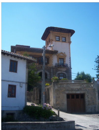
Subida desde Bustio

La comida no estuvo mal, pues un buen plato de paella y otro de bonito con tomate, junto con postre y café, hacen milagros. Salimos del restaurante en dirección al puente que separa Unquera de Bustio, y en la terraza de una cafetería encontramos a la pareja de Zaragoza que estaban tomando café y vimos como llegaba Patrik.