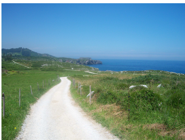
Senda costera (GR-E-9)