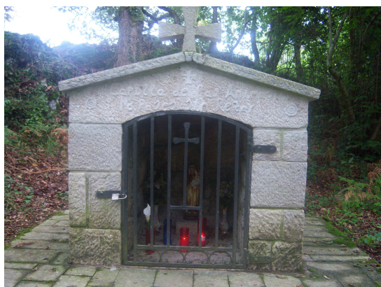
Capilla de las Ánimas