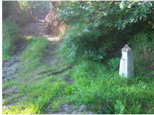
Final del camino por el monte

De repente una malla metálica corta el camino, es el vallado de una casa, e intento seguir tanto por la derecha como por la izquierda y no hay senda ni espacio para pasar. Ahora empiezo a entender porqué alguien ha pintado la flecha que vi anteriormente y vuelvo a desandar lo andado cuando veo bajar también al ciclista, que ha intentado pasar por el monte y lo único que ha conseguido ha sido arañarse el cuerpo. Me comenta que hace un año el había pasado por este camino y que no estaba cortado, que estaba señalizado y salía a la carretera mas adelante. Echamos unas cuantas “pestes” sobre los que construyen cortando los caminos y nos despedimos.