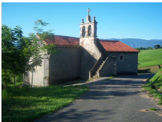
Ermita de Rubarcena