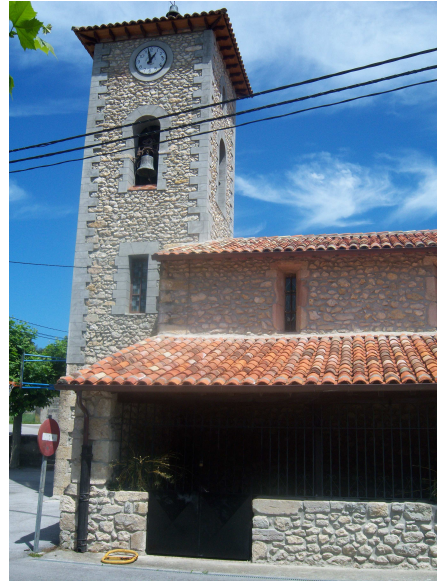
Iglesia de Serdio

El camino continúa en la misma tónica hasta Serdio. Paro en el bar “El Rincón” donde me refresco con una cerveza, allí me cuentan que hay un albergue de peregrinos con 16 camas y que está en parte superior de las antiguas escuelas, pues la parte inferior se utiliza como centro cívico (uno de los parroquianos del bar dice que para que jueguen al bingo las viejas), como no voy a quedarme no les pido las llaves, pues están depositadas aquí por si algún peregrino las necesita. Me despido de los presentes y tras recargar de agua vuelvo al camino.