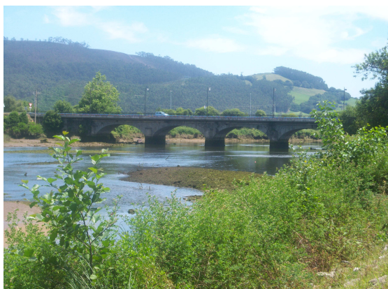
Puente de Pesues

Desde aquí, el suave descenso hace que casi sin darme cuenta, aparezca Unquera, donde dado la hora me detengo a comer, en un restaurante donde anuncian menú del día por diez euros. Al entrar observe a una pareja que parecía de peregrinos, pero no me sonaba haberlos visto, pero como las mochilas y vieiras nos delatan, enseguida cambiamos unas palabras. Eran Valencianos y habían estado en un hostel de Comillas, pues no sabían que hubiera un albergue en tan buen estado, se iban a quedar en Unquera, también en un hostel, pues aquí si que no hay albergue. Yo les comente que creía que en verano habilitaban un colegio para alojar a los peregrinos, pero que yo pensaba llegar a Colombres pues allí había un albergue, aunque no fuera específico para peregrinos.