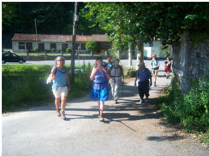
Grupo peregrinas alemanas

Junto a la carretera veo un grupo de peregrinas que están descargando mochilas y preparándose para caminar, me acerco y algunas hablan castellano y me cuentan que son alemanas, que hacen el Camino con apoyo de vehículos para no andar tanto, se van