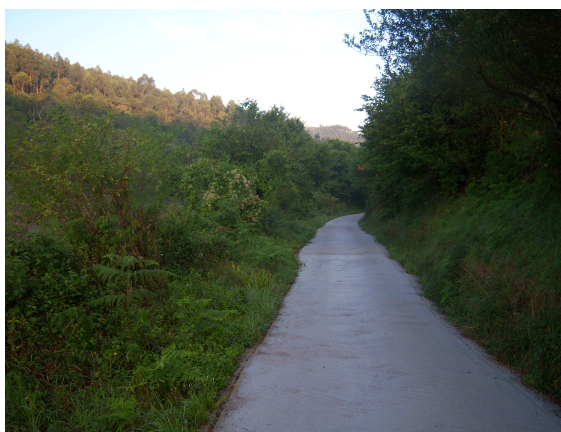
Camino verde (que lleva a la ermita)

Retrocediendo por la carretera por la que subí ayer, llego al mojón donde esta la doble señal que indica el albergue y el camino. Este se inicia en una estrecha carretera, de esas de asfalto antiguo y por las que apenas circula nadie, eso sí rodeada de verde y árboles que hacen agradable el camino. Por delante un grupo de seis peregrinos, me van