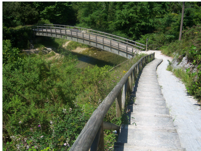
Puente sobre el río Pirón

El grupo de alemanas se quedó allí a almorzar, nosotros seguimos andando hasta llegar a otro lugar que según reza en un panel está considerado como de importancia comunitaria. Es la ensenada de la desembocadura del río Pirón, donde se pueden encontrar mamíferos como la nutria y el desmán, y peces como el salmón y la lamprea.