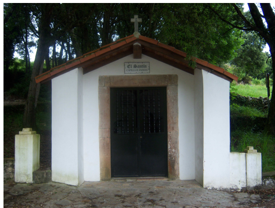
Capilla de Ánimas