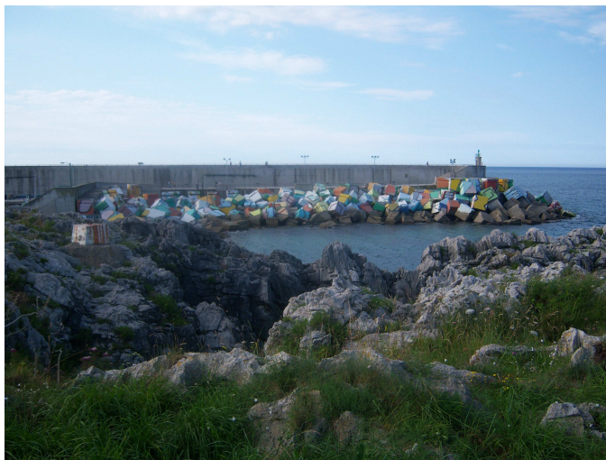
Escollera de Agustín Ibarrola

Doy una vuelta por el puerto y su famosa escollera decorada por Agustín Ibarrola, pero para apreciarla mejor cruzo al otro lado de la ría y pasando por la lonja, una escultura de una mujer esperando el regreso del pescador, los antiguos secaderos de redes y el faro, llego al mirador desde donde mejor se aprecia el conjunto de colores de la escollera. Al volver compro pan y fruta para la cena, así como algunos pequeños recuerdos, doy un corto paseo por la zona de bares y comercios y vuelvo hacia el albergue para descansar.