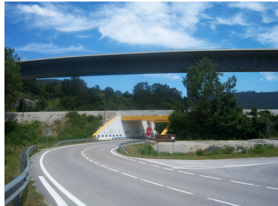
Tres vías de comunicación