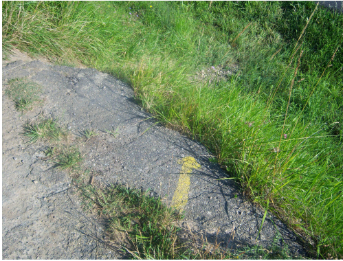
Señal hacia la carretera