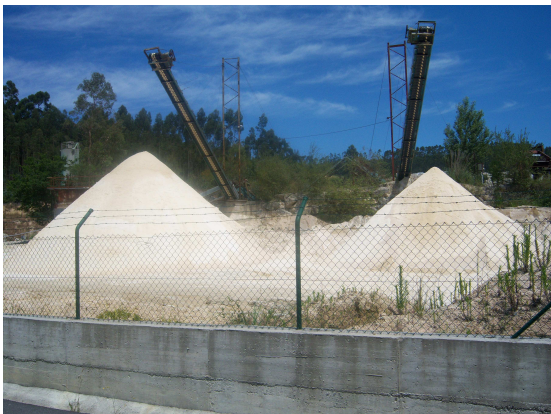
Montes de arena

Hacia Pesues, el camino se realiza por una carretera en la que el poco tráfico es la nota más destacable y la monotonía se rompe contemplando las curiosidades que te encuentras y que en cualquier otra situación pasarían inadvertidas. Como ejemplo valgan los montículos de arena de una fábrica, el paisaje sobre la “Tina Menor”, el cambio de carretera hacia otra más amplia en la que mirando a la izquierda se ve el pueblo de Muñorrodero pero sigo hacia la derecha donde se observa como en el camino se superponen las diferentes vías de comunicación, con la carretera pasando bajo el ferrocarril y ambos a su vez bajo la autovía, en fin algo con lo que entretener la mente hasta llegar a Pesues.