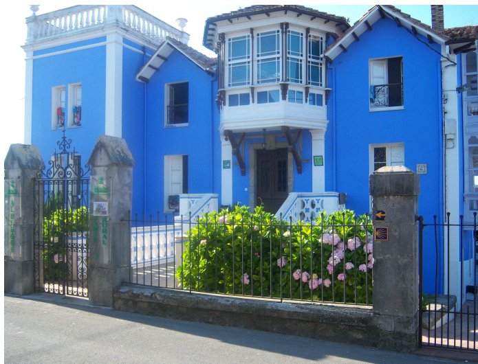
Albergue juvenil de Colombres