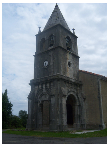
Iglesia de San Pedro de Pria

Desde aquí caminamos juntos y con el español que ella sabe y el “chapurreo” típico del camino vamos cambiando impresiones. Llegamos a Nueva y aparece el ciclista italiano al que le comento que su compañero va por delante y que le esperará en Ribadesella. Se despide de nosotros y seguimos caminando por el arcén hasta que llegamos a la iglesia de San Pedro.