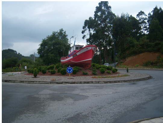
Rotonda con barco

Ya en la otra orilla teníamos la opción de seguir la carretera o caminar por el paseo marítimo. Nos decidimos por esta segunda opción, pues como ya no llovía el paisaje y el ambiente lo hacían mas apetecible. Pasamos por gran cantidad de palacetes (muchos de ellos convertidos en hoteles u otros servicios turísticos hasta que volvimos a la carretera que como una vía urbana mas, transcurre entre edificios y urbanizaciones hasta terminar en una rotonda en la que como si fuera el “Barco de Chanquete”, han varado uno de color rojo que indica el cruce de caminos.