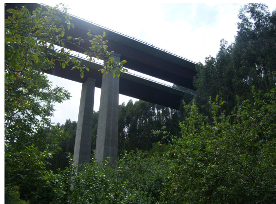
Bajo la autovía

Antes de tomar una senda por la que iniciaremos un descenso, intercalamos unas palabras con dos peregrinos que estaban almorzando junto a un grueso árbol, como no tenían agua les indicamos la casa donde tenían un grifo exterior y donde nos habían dado de beber, nos lo agradecieron y hacia allí se dirigió uno de ellos con un bidón.