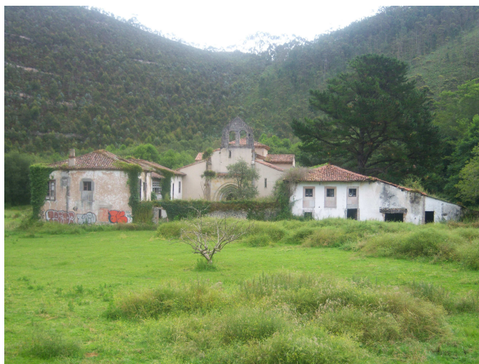
San Antolín de Beón

* La iglesia del monasterio de San Antolín de Beón.- A diez kilómetros de la villa de Llanes y cerca de la desembocadura del río Beón, donde comienza el valle de San Jorge, se ve en el solitario y romántico paisaje, rodeado de montañas, el antiguo y abandonado monasterio de San Antolín. Su fundación data de fines del siglo X, y siempre lo habitaron monjes de San Benito hasta el año de 1544 que fue abandonado y pasaron a San Salvador de Celorio. Es de arquitectura bizantina, con alguna mezcla de gótico, como resultado de la restauración a principios del siglo XIII por el abad llamado Jacobo. (Podemos ver la inscripción grabada en una de las columnas interiores que fechada en el año 1217).