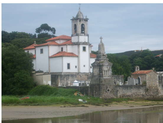
Iglesia N o S a de los Dolores

Desde Barro, el camino continua en la misma tónica, con la visión permanente de una iglesia blanca rodeada de un cementerio que parece que emerger del agua del mar (N a S a de los Dolores), caminando hacia ella y antes de alcanzarla existe una pequeña capilla de Ánimas. Allí me encuentro con dos caminantes que me cuentan que sobre esa iglesia que ha sido la visión permanente en este tramo hay una disputa entre Barro y Niembro por su titularidad y que luego pasaré junto a un antiguo monasterio del que se cuentan muchas leyendas. Allí mismo la senda inicia una ligera subida que me adentra entre árboles para caminar por una especie de atajo hacia Niembro.