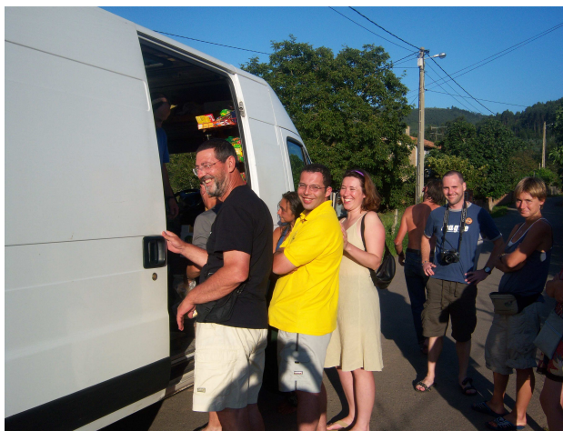
Comprando en la tienda ambulante