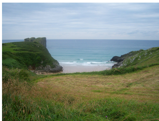
Cala del Portiellu