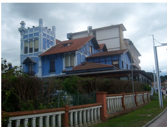
Antiguo palacio marqueses de Argüelles

Poco a poco nos estábamos acercando a Ribadesella y el camino nos llevó a la carretera general, pero por poco tiempo, pues enseguida las señales nos bajan por un camino interior, que rodeando al campo de fútbol, nos vuelve a subir a la carretera por la que entramos en Ribadesella. Dejamos a nuestra izquierda la estación de Feve y cruzando el centro urbano, enfilamos el puente que cruza el Sella. Este es el puente donde termina la prueba del descenso del Sella, denominada también “la fiesta de las piraguas”, que se celebra todos los años en el primer domingo de agosto, siendo por lo tanto uno de los puntos mas conocidos del pueblo.