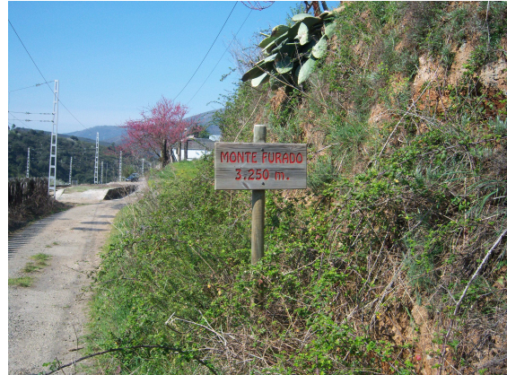
Cartel de Monte Furado

Seguimos por el camino lateral paralelo a las vías y volvemos a encontrar otro cartel, similar al anterior, pero en este caso con la leyenda Monte Furado 3.250 m., seguíamos sin entender lo de los metros, pero seguimos caminando y tras pasar por delante de la pequeña estación de ferrocarril, un poco más adelante llegamos al núcleo urbano, donde a la entrada nos encontramos una familia que estaba cortando las hierbas que crecían al pie de la tapia que rodeaba la casa, nos ofrecieron agua fresca, lo que aceptamos agradecidos, nos contaron que ellos también habían hecho el Camino hacía tiempo y que ya sabían que se estaba promocionando esta ruta, pero hasta ahora no había venido nadie, salvo los de la asociación que lo promocionaba. También nos contaron que la iglesia que se veía más arriba era la de San Miguel, que por lo visto tiene un bonito retablo y que más arriba había una fuente. Nos despedimos e iniciamos una pequeña subida, que nos dejó en una plaza delante de las escalinatas de la iglesia.