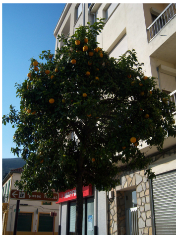
Naranja con naranjas

Como previamente había visto en Internet que existía un albergue (aunque no de peregrinos) preguntamos por el. Nos indicaron que estaba junto al auditorio y hacia allí nos dirigimos por la calle principal (antigua carretera), llena de naranjos. Al llegar vimos que estaba cerrado, pero llamamos al teléfono que figuraba en la puerta y el encargado nos contestó que vendría en un cuarto de hora.