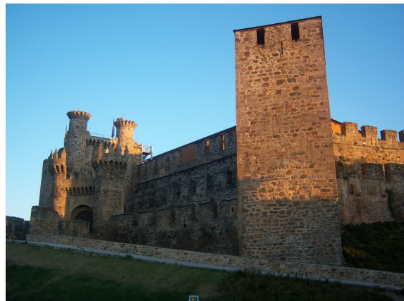
Ponferrada (Calle y Castillo Templario)