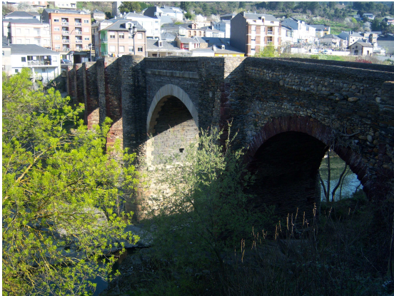
Puente de Sobradelo

casualidades de este viaje, pues nos puso en el camino a la persona indicada para mejorar nuestra ruta.