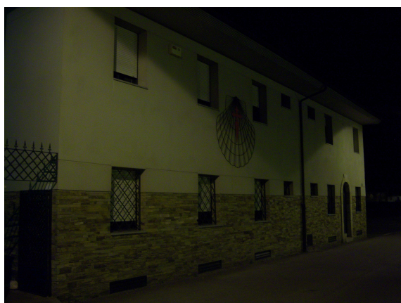
Exterior del albergue

Hablamos un rato sobre nuestro viaje y el suyo, pues iban a realizar un turno de noche a un centro de ancianos de Ponferrada (cuantos km para trabajar una noche). Así que con este entretenimiento finalizamos el viaje en autocar pasadas las 21, 30. Dado la hora decidimos comprar un par de bocadillos en la estación de autobuses pues algo habría que comer antes de dormir y sabíamos que antes de llegar al albergue no encontraríamos nada abierto.