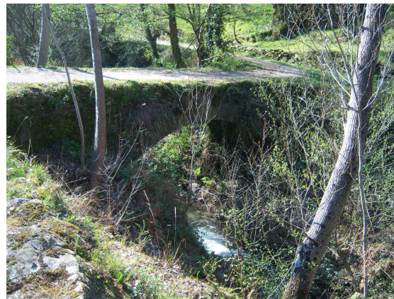
Puente en Fraga Furada

Al poco rato entre los km 53-52, encontramos un poste con una flecha de madera, que indicaba la entrada al camino, bajamos por el hasta que llegamos al fondo del valle y al poco de caminar encontramos un cartel que en letras rojas decía Fraga Furada 1.490 m., no sabíamos que quería decir, pero nos imaginábamos que sería una localización del lugar donde nos encontrábamos, pero no entendíamos lo de los metros. Un poco más adelante encontramos un arroyo cruzado por un puente sin petril y a continuación a la izquierda un camino que conducía a un par de casas enclavadas en el monte y que miraban hacia el arroyo, que en este caso estaba canalizado por unos muros de piedra, imaginamos que serían restos de un antiguo conducto de molino o similar. Cruzamos el puente y enseguida al fondo, junto a las casas apareció un pequeño puente por el que pasaban las vías del tren.