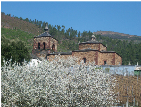
Iglesia de San Miguel

Seguimos por el camino lateral paralelo a las vías y volvemos a encontrar otro cartel, similar al anterior, pero en este caso con la leyenda Monte Furado 3.250 m., seguíamos sin entender lo de los metros, pero seguimos caminando y tras pasar por delante de la pequeña estación de ferrocarril, un poco más adelante llegamos al núcleo urbano, donde a la entrada nos encontramos una familia que estaba cortando las hierbas que crecían al pie de la tapia que rodeaba la casa, nos ofrecieron agua fresca, lo que aceptamos agradecidos, nos contaron que ellos también habían hecho el Camino hacía tiempo y que ya sabían que se estaba promocionando esta ruta, pero hasta ahora no había venido nadie, salvo los de la asociación que lo promocionaba. También nos contaron que la iglesia que se veía más arriba era la de San Miguel, que por lo visto tiene un bonito retablo y que más arriba había una fuente. Nos despedimos e iniciamos una pequeña subida, que nos dejó en una plaza delante de las escalinatas de la iglesia.