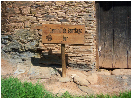
Rótulo del Camino Sur