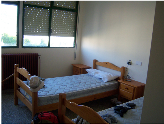
Habitación del albergue