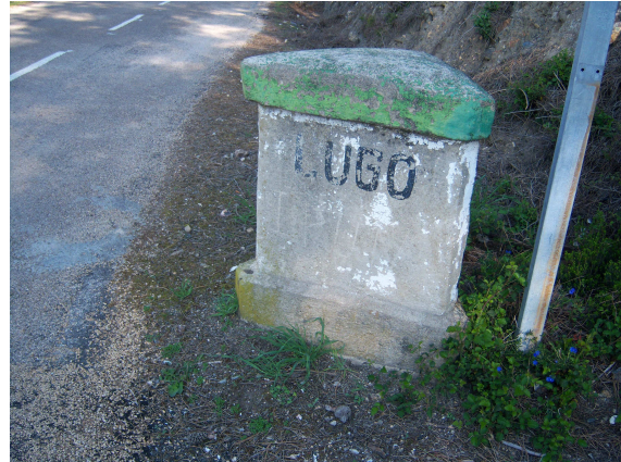
Mojón provincia de Lugo

Al poco rato encontramos en una pequeña altura el pequeño núcleo urbano de Alvaredos, al que sobrepasamos por su parte baja y al poco escuchamos el ruido de una motosierra. Al acercarnos encontramos una pareja cortando un tronco en la ladera, cruzamos unas palabras con ellos y la mujer (otra de esas casualidades) nos indicó que para llegar a Montefurado no era necesario seguir por la carretera, que esta daba muchas vueltas y que pasadas dos curvas encontraríamos un camino que nos ahorraría bastante trecho.