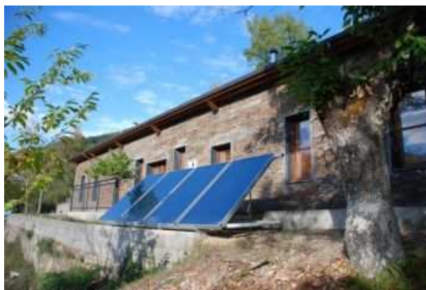
Albergue de peregrinos de Xagoaza

El albergue de peregrinos fue construido pensando en el reconocimiento oficial del Camiño de Santiago de Inverno, que discurre por Valdeorras, como itinerario Xacobeo. Esto será antes del Año Santo del 2010.