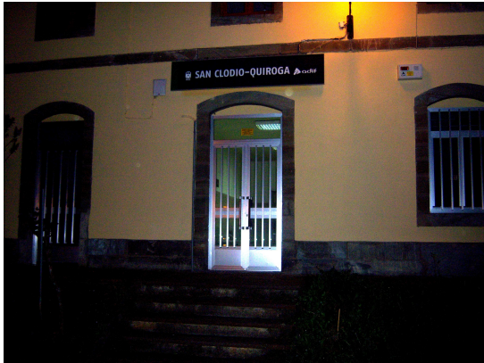
Estación de San Clodio-Quiroga

La estación estaba solitaria y nos extrañó, no obstante como era bastante pronto pensamos que ya llegaría alguien o tal vez nadie, salvo nosotros, iniciaba aquí su viaje. Poco a poco pasaba el tiempo y cuando llegó la hora y el tren no apareció, pensábamos que traía retraso.