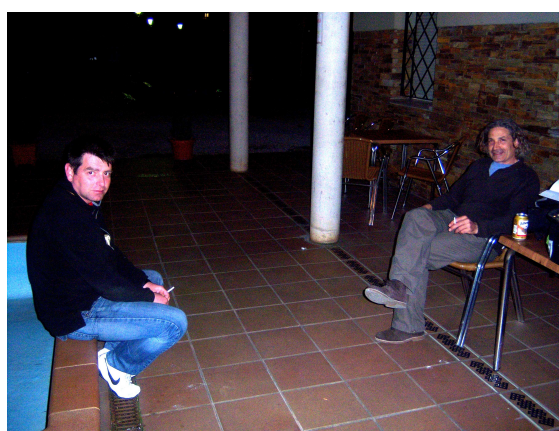
Hospitalero y peregrino