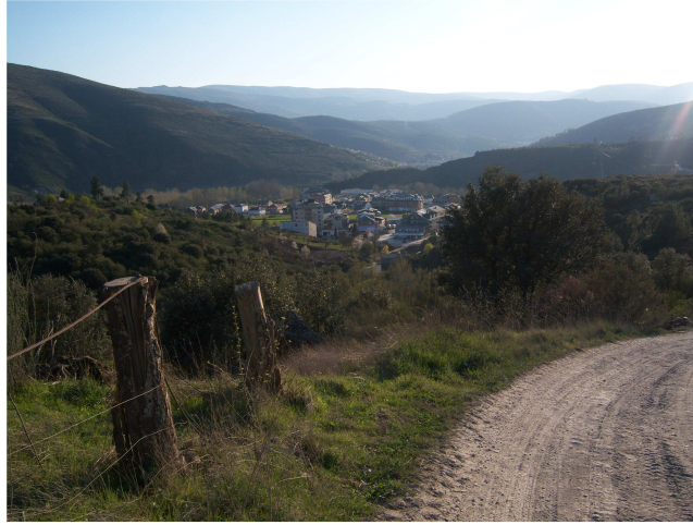
Puente de Domingo Flórez

Enfrente mismo de la gasolinera encontramos el hostel “La Torre”, que era el que nos habían recomendado en la casa de comidas de Las Médulas. Entramos y nos sentamos para beber algo fresco. Hablando con la camarera, también nos dimos cuenta que no esperaba ver peregrinos, nos selló la credencial con el sello del hostel, para que por lo menos quedara constancia de nuestro fin de etapa. Mientras tanto pensamos que hacer, buscar alojamiento preguntando si acogen peregrinos en algún polideportivo o similar, pues nos informaron que no existe albergue, o visto que aquí no parece que estén acostumbrados al acogimiento alojarnos en el hostel.