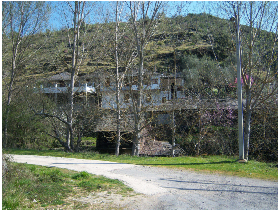
Casas en Fraga Furada