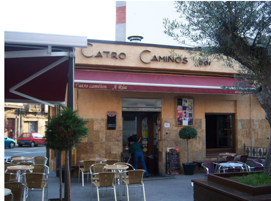
Bar “Cuatro Camiños”

Llegamos al bar y aunque la persiana estaba medio subida, pues todavía no habían terminado de limpiar, nos dieron de desayunar un buen café con leche y unas tostadas de pan con mermelada de naranja natural, pues todavía no les había llegado la bollería reciente del día. La conversación de la camarera nos hizo bastante ameno este desayuno, así que con este buen inicio del día retomamos nuestras mochilas y seguimos la carretera hacia la salida del pueblo.