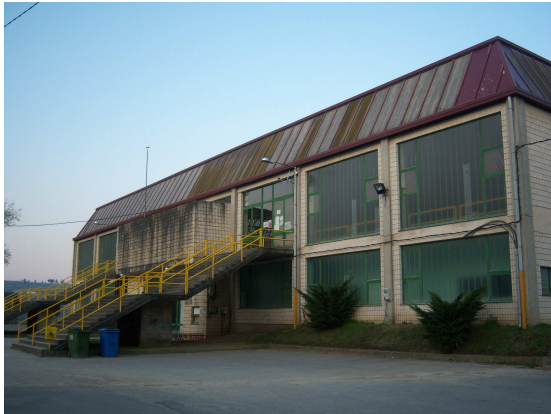
Polideportivo de A Rua

Por las cristaleras entraba la luz, así que no hizo falta ningún despertador para que nos levantásemos. Recogimos tranquilamente la que había sido nuestra habitación, colocamos las colchonetas en su sitio y con nuestros sacos recogidos nos dirigimos al vestuario arbitral para el aseo y prepararnos para iniciar la ruta. Cuando estuvimos preparados, subimos las gradas del polideportivo y por una de sus puertas de emergencia salimos al exterior. Comprobamos que estaba perfectamente cerrada y tras admirar el paisaje que se nos ofrecía, con una zona de recreo y el río a la derecha, descendimos las escalinatas e iniciamos el camino hacia el bar “Cuatro Camiños” para desayunar.