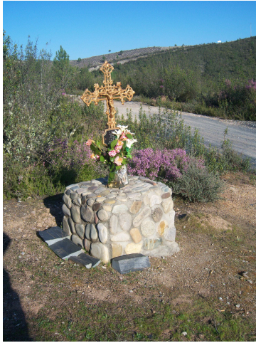
Monumento a cazador

Cuando terminamos de comer, estuvimos un rato reposando la comida en el exterior y cuando consideramos oportuno marcharnos, muy amablemente nos indicaron por donde debíamos tomar la pista que bordeando la ladera nos conduciría a nuestro destino. Pasamos por delante de un monumento a un cazador fallecido y acompañados de sol y calor caminamos los más de 8 km. que tras un prolongado descenso desembocan junto a una gasolinera de la N536, en Puente de Domingo Florez.