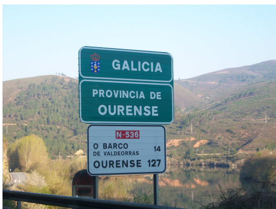
Entrando en Galicia

Llegamos a un pequeño pueblo, San Xusto, donde no hay prácticamente nadie por las calles, seguimos y en nuestro camino encontramos varias industrias donde cortan pizarra para la construcción, esta es una actividad muy extendida en esta zona y así lo atestiguan todos los tejados de casas antiguas y modernas que están realizados con este material.