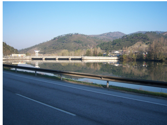
Una de las presas sobre el Sil

Pronto llegamos al pueblo de Sobradelo y en el bar “Los dos Ríos” entramos a descansar y tomar un “Aquarius”, allí la dueña y uno de los parroquianos nos informaron que para ir hacia O’Barco, lo mejor era que cruzáramos el puente, ya que al otro lado y después de pasar por debajo de las vías del tren, una empinada cuesta a la izquierda, nos llevaría a la antigua carretera, por la que adelantariáramos camino y además apenas tiene tráfico. Esta fue otra de las