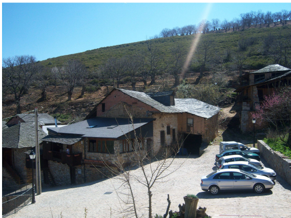
Restaurante “El Lagar” en Orellán

Salimos del restaurante y antes de iniciar la marcha visitamos la tienda de artesanía, que tenía cosas bastante interesantes, pero aunque no compramos nada, charlamos un rato con su propietaria, que también se extrañó de ver peregrinos, pues pensaba que a Santiago solo se podía ir por el Camino Francés. Nos despedimos y retomamos la ruta por un camino que desde la ladera nos bajó hacia un panel informativo de la zona y allí por el camino rural rodeados de tierras y montículos rojizos que nos recuerdan que allí se ubicaron las minas a cielo abierto donde los romanos extrajeron oro, y que hoy se ha convertido en un parque arqueológico Patrimonio de la Humanidad. Después tras un corto tramo de carretera llegamos al pueblo de Las Médulas.