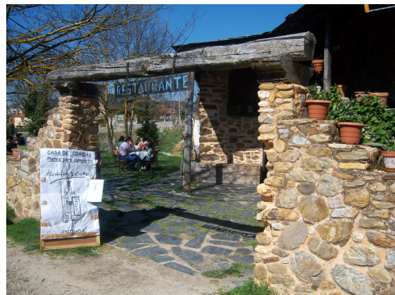
Casa de comidas Arcadio Travieso

Como se celebraba el Día del Padre, el pueblo estaba lleno de familias y grupos que le daban aún mas la apariencia de zona turística. Atravesamos el pueblo buscando un restaurante donde comer, pero al pasar por delante observábamos que estaban llenos y además nos parecían poco acogedores, hasta que al llegar prácticamente al final del pueblo vimos uno que se anunciaba como casa de comidas Arcadio Travieso. Nos acercamos y decidimos quedarnos allí a comer. Estaba situada en una antigua casona, con un prado donde había instaladas unas cuantas mesas (todas llenas). Entramos y nos acomodaron en un comedor con paredes de piedra y mesas de madera con bancos corridos, aparte de una gran chimenea, las paredes estaban decoradas de varios utensilios rurales, sonaban rancheras mejicanas como música de fondo. Comimos un típico caldo, huevos fritos con patatas (de esos que saben a huevo y tienen puntillas), unas castañas caramelizadas en almíbar y para rematar café de puchero y un “chupito de mandrágora”. Vamos todo un lujo, servido con amabilidad y por 12 €.