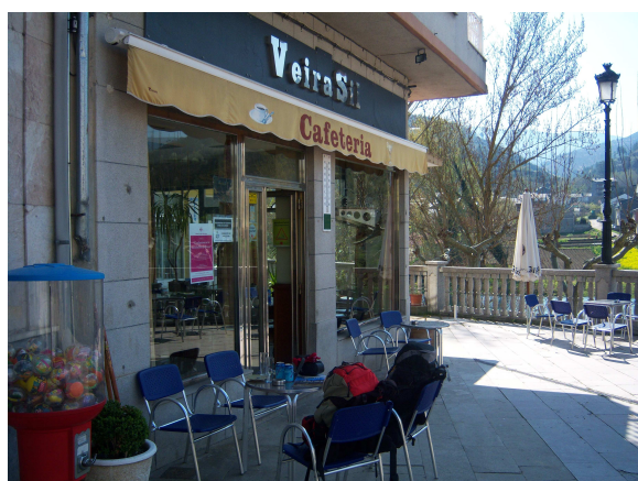
Cafetería “Veira Sil”

Le comentamos que no, que queríamos llegar hasta A Rua, pero no obstante nos enseñó varias revistas de la zona con rutas senderistas e información sobre el albergue y el “Mosteiro” que es la acepción gallega que aquí utilizan. Pero la mejor información nos la dio posteriormente, siendo esta otra de las casualidades a las que me he referido anteriormente, pues nos informó que no era necesario volver a la carretera para continuar el Camino, pues se estaba intentando rehabilitar el antiguo Camino Real y había un trozo por el que ya se podía transitar que partía de allí mismo, siguiendo la margen del Sil y que nos evitaba varios km. de carretera, aunque posteriormente tendríamos que volver al asfalto en A Proba y continuar por la comarcal que habíamos utilizado anteriormente que nos llevaría hacia el centro de A Rua.