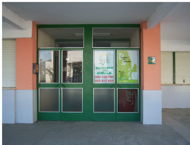
Puerta del albergue

Mientras esperábamos su llegada nos acercamos a un bar cercano, como no, a beber un “Aquarius”, cuando terminamos y volvimos al albergue, se abrió la puerta y el encargado nos explicó que le habíamos pillado con el arroz de una paella a medio hacer, que por eso nos había hecho esperar. Le contamos que éramos peregrinos a Santiago y que buscábamos albergue, el nos dijo que era el primer caso de peregrinos que tenía, que ciertamente hacía mas de un año había ido con un concejal en un “todoterreno” a pintar las flechas amarilloverdosas que habíamos visto y entonces le auguró la llegada de peregrinos, ese augurio se cumplía hoy.