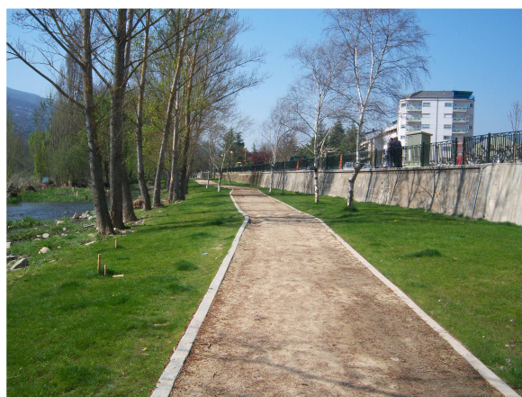
Siguiendo el “Camino Real”

Nos despedimos de él y de dos parroquianos que colaboraron en la información y nos dispusimos a seguir la margen derecha del río, primero por un paseo urbanizado para posteriormente volver a pisar la tierra por una senda perfectamente definida que como bien nos habían indicado nos devolvió a la carretera. Allí tuvimos otra sorpresa, pues justo antes de una rotonda encontramos la primera flecha amarilla que nos indicaba que estábamos siguiendo el Camino de Santiago.