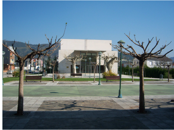
El auditorio desde el albergue

Era un restaurante preparado para comida rápida y clientes jóvenes, nos sentamos y a parte de la carta nos ofrecieron lasaña cosa que aceptamos inmediatamente, la ración fue suficiente para que después solo tomáramos café. Como el nombre del restaurante nos llamó la atención les preguntamos cual era su origen, nos contestaron que correspondía con el nombre de una cascada o salto de agua y como este era el tercero de la cadena le habían añadido el 3. Con nuestra curiosidad satisfecha nos retiramos a descansar al albergue. Nos aseamos y nos tumbamos en la cama dentro de nuestros sacos para dormir una siesta.