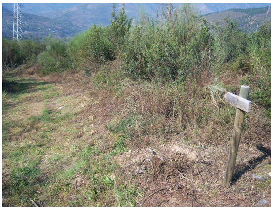
Camino a Montefurado

Al poco rato encontramos en una pequeña altura el pequeño núcleo urbano de Alvaredos, al que sobrepasamos por su parte baja y al poco escuchamos el ruido de una motosierra. Al acercarnos encontramos una pareja cortando un tronco en la ladera, cruzamos unas palabras con ellos y la mujer (otra de esas casualidades) nos indicó que para llegar a Montefurado no era necesario seguir por la carretera, que esta daba muchas vueltas y que pasadas dos curvas encontraríamos un camino que nos ahorraría bastante trecho.