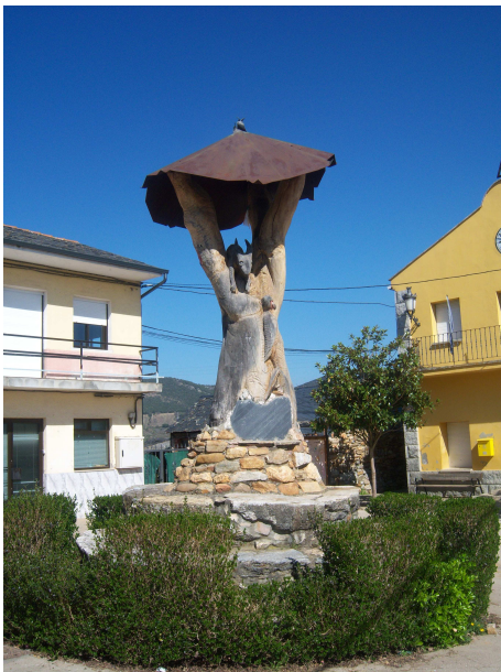
Árbol esculpido en Borrenes

El de la izquierda señala la dirección al castillo de Cornatel (un castillo templario que servía de apoyo al de Ponferrada), pero como está a más de un km y en subida decidimos que la visita la dejaremos para hacerla en coche, así que hacia la derecha seguimos una de esas carreteras comarcales casi sin tráfico que nos lleva a Borrenes. En el transcurso de la caminata, recuerdo lo que me contaron sobre este camino que ya era utilizado por los romanos para transportar el oro de Las Médulas, tanto hacia León (Legio VII) como en sentido contrario hacia Orense. Otras fuentes quizá no tan fiables me contaron que este mismo camino fue el que utilizaron los Templarios para llevar sus tesoros hacia Portugal cuando el Temple fue disuelto, atravesando Las Médulas, aprovechando la cobertura de los castillos de Ponferrada y Cornatel y de la existencia de algunos monasterios en la misma ruta. Así que con estos pensamientos los tres km que nos separaban de Borrenes pasaron rápido.