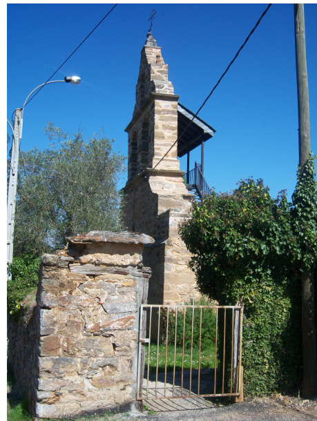
Espadaña en La Chana