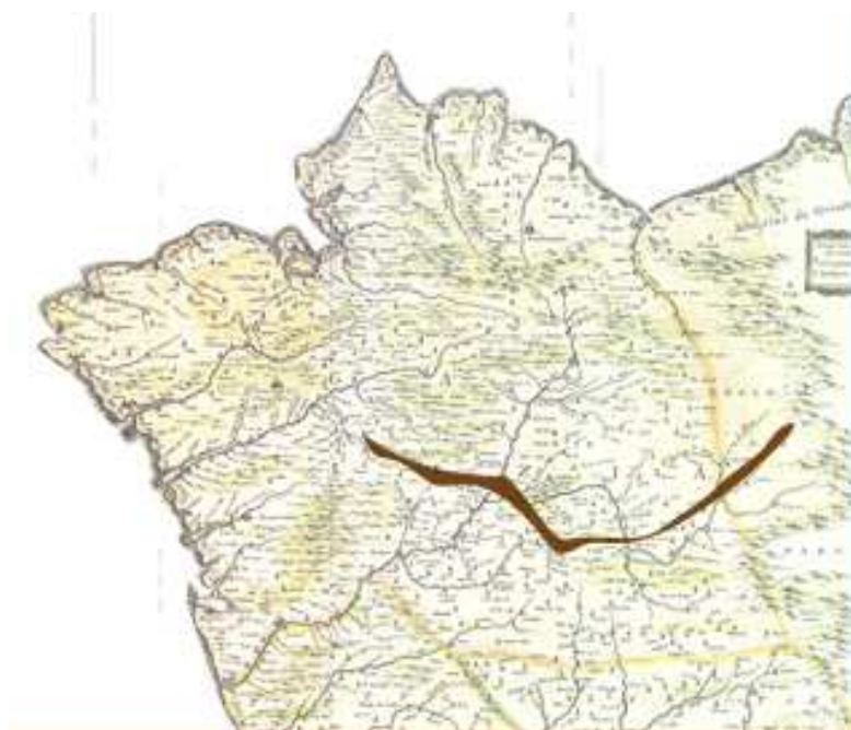
Perfil del “Camiño de Inverno”

Según los historiadores el Camino Sur o también llamado “Camiño de Inverno” era la entrada natural al territorio gallego, evitando los grandes escollos montañosos, y sirvió de enlace entre el reino de Galicia y el Castellano-leonés. Se reactivó entre los siglos XVII y XIX, cuando se traza el Camino Real, que sigue prácticamente la antigua ruta, y sirvió para establecer una corriente comercial entre ambos reinos. Parte desde Ponferrada (León), un punto neurálgico del tradicional Camino Francés, desde el que se ataca el famoso monte de O’Cebreiro, que da paso a Galicia, precisamente la zona que muchos peregrinos preferían para evitar la nieve y las avenidas de agua propias de la época invernal en la montaña leonesa. Más recientemente, la llegada del ferrocarril a Galicia, en 1873, se hace casi paralelamente a este camino, porque ofrecía menos dificultades orográficas”.