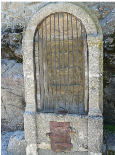
Urna de “mandas pías”

El descanso después de este tramo se hace obligatorio, además es la hora propicia para comer. Como el único restaurante que hay en el pueblo está cerrado por reforma, no nos queda mas remedio que comer queso y chorizo del que llevamos en la mochila. Como habíamos sido previsores por la mañana al comprar el pan, teníamos todo lo necesario para reponer fuerzas, así que mirando el muelle fluvial flotante del club náutico y algunos pequeños barcos que hay amarrados a la orilla, dimos cuenta de nuestras viandas y tras reposar la comida, decidimos cruzar el puente para continuar hasta Chantada, ya que aquí no hay posibilidades de alojamiento. ¡Qué buen final de etapa sería este si estuviera acondicionado para acoger peregrinos!