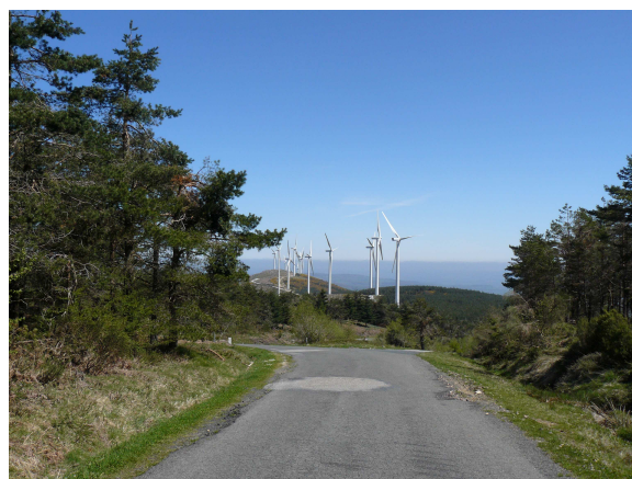
Bajada hacia Rodeiro

Aquí se nos plantea una duda, pues aunque nos apetece seguir por la cresta somos conscientes que debemos estar en Rodeiro hacia las 14,30, pues debemos coger el autocar que nos lleve hasta el coche para volver, así que elegimos la vía mas corta e iniciamos el descenso por la carretera, que desciende con largas vueltas por la ladera del monte. Casi cuando estábamos abajo nos alcanzó el coche de la familia anterior que se ofreció a llevarnos las mochilas, cosa que no aceptamos. También hablamos con los guardias civiles de un coche que nos indicaron que faltaban unos tres km. para Rodeiro (a estos no les habían enseñado a calcular bien).