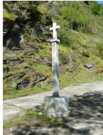
Crucero de Barxa de Lor

En estos menesteres estábamos cuando vemos venir por el camino a una mujer del pueblo, que nos explica que en una casa junto al puente hay un bar, pero como ya estamos terminando de almorzar decidimos no volver a bajar. Le preguntamos cual de los dos caminos que parten de allí es el de Santiago, pues la flecha no está muy bien definida, nos indica el de la derecha y además que a algo más de dos Km. está la casa rural de Salcedo, donde se puede comer. Hacemos caso a esta información (luego nos pesará) e iniciamos la andadura por ese camino.