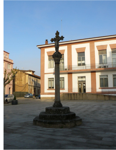
Crucero de San Antonio

Desde allí, pasando por delante del Ayuntamiento (parece que está construido como si fuera el edificio de una escuela) y un poco mas adelante una moderna iglesia circular con la torre campanario separada, llegamos a un cruce de caminos (rotonda) en la que un típico hórreo la integra un poco en el paisaje, donde iniciamos el camino por la carretera de “A Vide”.