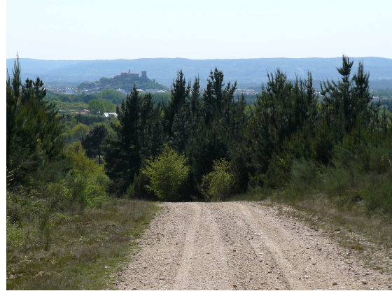
Al fondo Monforte de Lemos

Comenzamos a descender hacia Monforte a través de pinar y al fondo se observa sobre una colina la silueta del Castillo (hoy día parador), así que con esta visión del fin de nuestra etapa, pasamos por Reigada y poco antes de cruzar la vía del tren, encontramos una fuente en la que una joven está llenando bastantes garrafas de agua, nosotros hacemos lo mismo con nuestras cantimploras y tras cruzar las vías nos adentramos por sus calles hasta que enfrente de la Estación de RENFE, encontramos unas flechas que indican la salida hacia el Camino, así que tras tomarnos un “Aquarius” en un bar y como aquí no hay albergue para peregrinos, nos acercamos al hostel “Riosol”, frente a la estación, donde por 40 € nos acomodan en una habitación de dos camas que no está nada mal.