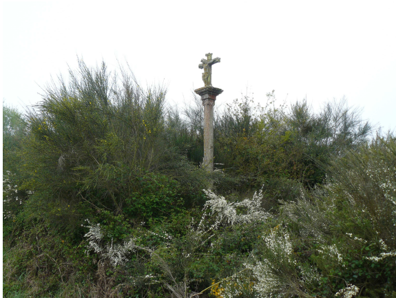
Crucero entre la maleza

Seguimos la carretera, que no presenta ninguna dificultad y pasamos por Lucenza, donde descubrimos un crucero casi tapado por la maleza, lo que nos sorprende bastante ya que suelen ser lugares siempre visibles y despejados. Continuamos por la carretera, donde en algunos tramos todavía se nota la persistencia de la niebla.