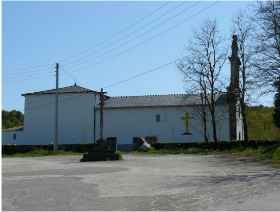
Iglesia de Cereixa