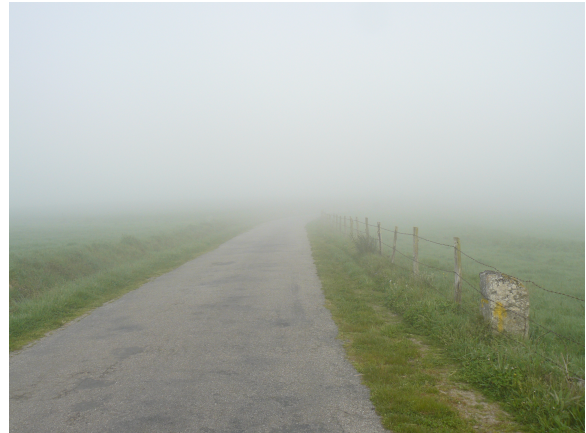
Carretera flecha y neblina

Llegamos a Penasillas, el último pueblo antes de iniciar la subida al Monte Faro. En el centro de la plaza hay una pequeña ermita y como no encontramos ningún lugar donde tomar algo y ni siquiera una fuente, decidimos parar junto a una de las casas de la carretera para comer unas barritas de cereales, beber un poco de agua y quitarnos las prendas de manga larga, pues ya tenemos el cuerpo entonado y empezamos a notar algo de calor.