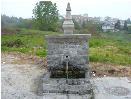
Fuente en Chantada

Después de una noche en la que los colchones no nos permitieron acomodar los cuerpos como nosotros hubiéramos querido, nos levantamos a eso de las siete y media. Después del aseo pertinente y acondicionar nuestras mochilas, bajamos a desayunar. El bar estaba cerrado, pues todavía estaban realizando la limpieza de los restos de la eufórica noche, pero a nosotros nos abrieron, supongo que porque además nos tenían que cobrar la habitación. Desayunamos como casi siempre un café con leche y en este caso acompañados de unos sobaos pequeños de seos que vienen envasados en paquetes grandes, pues a esta hora no hay bollería reciente. Abonamos la cuenta y salimos del Hostal para cargar nuestras cantimploras con el agua de la fuente que está enfrente que nos han dicho que es muy buena.