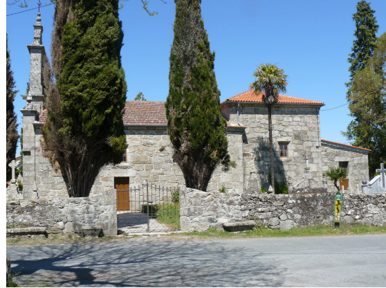
San Pedro de Lincora

Cuando ya parece que hemos llegado al final de la subida, otro cartel nos indica que todavía faltan casi dos km para llegar a San Pedro de Lincora, por suerte esta subida es menos pronunciada y en algo más de media hora llegamos a al conjunto de iglesia y cementerio que le hacen un conjunto singular. Descansamos un poco y reiniciamos la marcha por la carretera que nos llevará hasta Chantada, que después del tramo que hemos realizado, resultaría un paseo, si no fuera por el esfuerzo realizado, tanto en la bajada como en la subida desde el Sil.