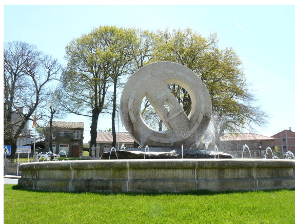
Rueda monumental en la plaza

Pasamos la plaza, que está presidida por la representación monumental en piedra de una rueda típica de los carros gallegos y llegamos justo a las 14,30 horas como teníamos previsto al “Bar Centro”. Pedimos, como no, un “Aquarius” y algo para picar, nos dijo que solo tenía chorizo o queso y de eso nosotros ya teníamos. También le preguntamos si tenía sello del bar para estampar en la credencial, dado que por lo ajustado de la hora no era posible acercarnos a ningún sitio oficial, aparte de que al ser domingo dudo que hubiera algo abierto o pudiéramos contactar a tiempo con la policía municipal de guardia. Como nos contestó que sí tenía sello, pero no tinta nos quedamos sin sellar. Ya lo haremos cuando volvamos para continuar desde aquí. Así que cuando terminamos la consumición nos cruzamos a la otra acera y nos sentamos en la puerta de una clínica dental para esperar a que llegara el autocar que hace el trayecto Santiago – Monforte y que así sucedió pasadas las tres de la tarde.