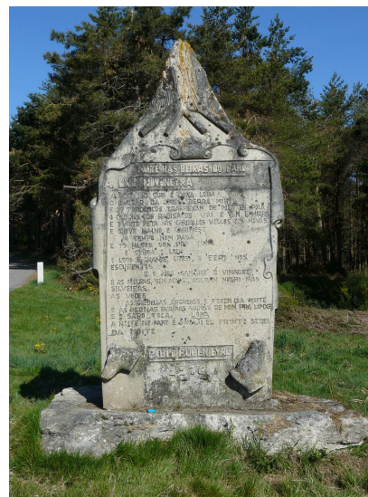
Límite Lugo –Pontevedra