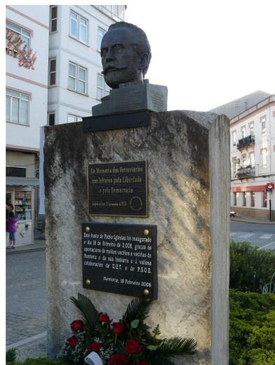
Busto de Pablo Iglesias

Después del pertinente aseo y descanso, la visita a la ciudad fue pospuesta para mejor ocasión, pues estábamos bastante cansados por la caminata, así que se saldó con un vistazo a la información turística que encontramos en el hostel, donde me llamó especialmente la atención de una tau roja en su escudo heráldico, que yo asocié a los Templarios, pero estaba equivocado *. Solo realizamos una breve visita a los alrededores, llamándonos especialmente la atención la existencia frente a la estación de un monumento, construido mediante aportaciones de los trabajadores, dedicado al fundador del Partido Socialista y la U.G.T. Pablo Iglesias, que como hoy es primero de mayo (día del trabajo), tiene en su base una ofrenda floral de rosas rojas.