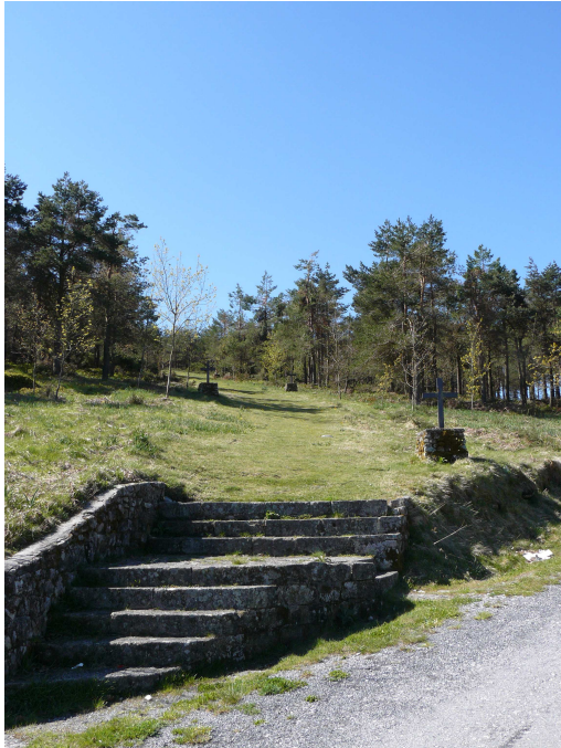
Inicio del Vía crucis

La subida por la senda del monte, termina en la carretera que también sube por el y con la presencia de un monolito que separa las provincias de Lugo y Pontevedra. Continuamos por la carretera y enseguida encontramos un área de recreo con mesas y bancos de piedra preparada para hacer barbacoas. Nos imaginamos que estamos cerca de la ermita y que en esta es donde se celebrarán las romerías (luego vimos otras mas adelante), así que decidimos utilizarla y descansar. Aprovechamos para comer algo de queso con pan (que teníamos de ayer) y otras necesidades que aligeran el cuerpo.