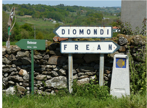
Indicación de Belesar

Seguimos por la carretera, de la que nos apartamos en algunos tramos para volver a ella, hasta que llegamos a Cerceiro, en dirección a Montecelo que se divisa a lo lejos. Aunque el camino no es malo se nota que ya van pesando las piernas, pero todavía no ha llegado el mayor esfuerzo pues este empieza a estar indicado cuando llegamos a un cruce en el que se entrecruzan los indicativos de población de la carretera (Diamondi y Frean), un mojón del Camino que nos marca la dirección y una tablilla que indica la distancia a Belesar y el tiempo que lleva recorrerla, 1, 35 horas, y aquí empieza un tramo en el que las rodillas se ponen a prueba, pues al poco rato iniciamos un descenso por una ladera en la que se cultivan las viñas de denominación “Ribeira Sacra”, en pequeños trozos de viñedo escalonados en terrazas.