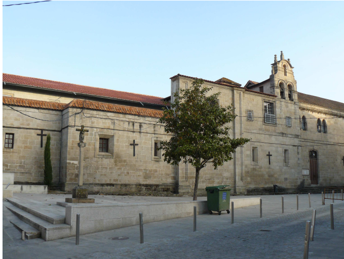
Convento de las MM Clarisas