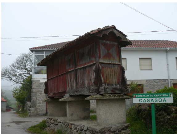
Hórreo en Casasoa

Seguimos las flechas y nos llevan por detrás del hostel hasta la antigua carretera de Lalín. El camino es en ligera subida y al poco de andar (creo que es en Santa María de Afora) encontramos un curioso altar de piedra dedicado a las “Ánimas benditas”, que se ve bastante abandonado. La carretera va pasando por diversos núcleos pequeños y en el de Casasoa nos llama la atención un hórreo que conserva restos de pintura roja y figuras geométricas (creo que es el primero que vemos con estas características). Un poco mas adelante y a nuestra derecha, entre la neblina reinante se ve una iglesia con un vistoso campanario, junto al cementerio, debe ser San Jorge de Asma.