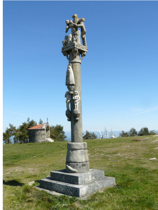
Crucero en el Monte Faro

Dispuestos a culminar la subida volvemos a la carretera, hasta que las flechas nos indican la subida por una ladera de hierba que siguiendo las catorce estaciones de un Vía debe terminar en la ermita, así que sin pensarlo dos veces iniciamos la “penitencia”, contando una a una hasta que al llegar a la última nos dimos de frente por el conjunto del Monte Faro, pues lo que nosotros pensábamos encontrar era solo una ermita y aquí esta está complementada por cuatro monolitos de piedra (uno en cada uno de los puntos cardinales), en cada uno de ellos figura una canción de un juglar, que no pensamos leer, si tenemos interés ya lo haremos sobre la foto. Nos acercamos a la ermita, que es del siglo XVIII y nos sorprende la ausencia de campanario y la robustez de su construcción.