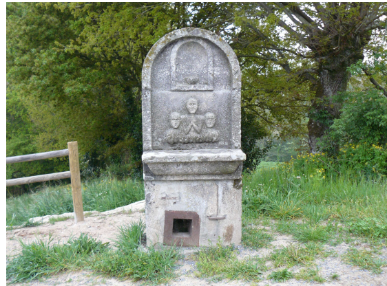
Altar de “Ánimas”

Seguimos las flechas y nos llevan por detrás del hostel hasta la antigua carretera de Lalín. El camino es en ligera subida y al poco de andar (creo que es en Santa María de Afora) encontramos un curioso altar de piedra dedicado a las “Ánimas benditas”, que se ve bastante abandonado. La carretera va pasando por diversos núcleos pequeños y en el de Casasoa nos llama la atención un hórreo que conserva restos de pintura roja y figuras geométricas (creo que es el primero que vemos con estas características). Un poco mas adelante y a nuestra derecha, entre la neblina reinante se ve una iglesia con un vistoso campanario, junto al cementerio, debe ser San Jorge de Asma.