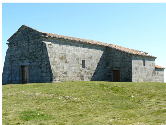
Ermita Nª Sª de Faro

Camino trazado por la cresta de los montes, al pié de los molinos generadores de electricidad que da un rodeo por otros pueblos y que son mas de doce kilómetros. El otro es seguir la carretera y que aproximadamente son ocho kilómetros.