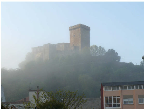
Castillo de Monforte

Lo poco que pudimos ver de Monforte en el día de ayer, hoy lo suplimos al cruzar alguna de las calles, en la que como testimonio de ciudad ferroviaria, pasamos por delante del “Colegio de ferroviarios”, hasta que llegamos al paseo que nos lleva paralelos al río Cabe, donde entre neblinas vemos en lo alto la impresionante torre y silueta del castillo y al fondo el puente medieval por el que deberemos cruzar.