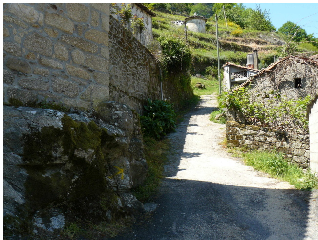
Inicio de la subida

Chantada, según nuestro mapa se encuentra a algo mas de ocho km, que no sería mucho trecho si no fuera porque vemos que para alcanzar de nuevo la cota por donde veníamos hay que subir por la ladera de enfrente que es similar a la que hemos dejado atrás. Al otro lado del puente, antes de iniciar la subida pasamos por delante de la urna de “mandas pías” * y sin mas dilación empezamos el ascenso que sigue en parte el trazado de una calzada romana, poco a poco y sin darle un ritmo fuerte para dosificar las fuerzas.