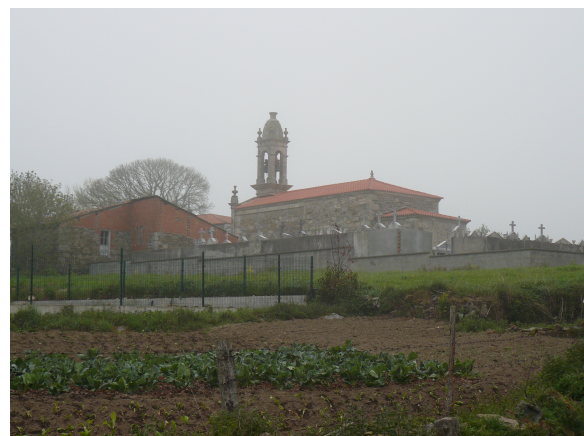
Iglesia y cementerio de Asma