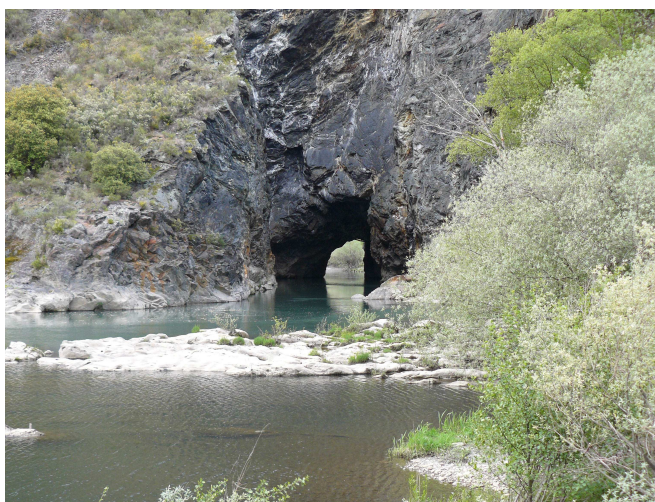
Túnel de Montefurado