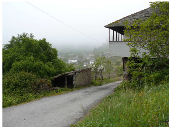
Al fondo Nocedo

Al poco de iniciar la subida, una flecha en una pared de piedra, nos indica que debemos abandonar la carretera e iniciar la subida por una pista, que poco a poco nos lleva hacia un pinar, el paisaje está con neblina y tras los pinos solo se adivina algo del paisaje, llegamos a una construcción blanca y sencilla con una puerta verde, es la ermita de la Virgen de los Remedios, cosa que se aprecia al acercarse, pues carece exteriormente de cualquiera de los aditamentos típicos (cruces o campanas).