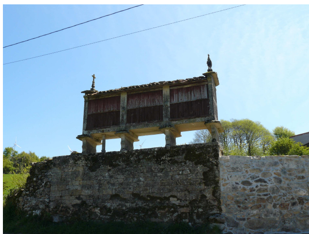
Hórreo en Loureiro

Aquí se nos plantea una duda, pues aunque nos apetece seguir por la cresta somos conscientes que debemos estar en Rodeiro hacia las 14,30, pues debemos coger el autocar que nos lleve hasta el coche para volver, así que elegimos la vía mas corta e iniciamos el descenso por la carretera, que desciende con largas vueltas por la ladera del monte. Casi cuando estábamos abajo nos alcanzó el coche de la familia anterior que se ofreció a llevarnos las mochilas, cosa que no aceptamos. También hablamos con los guardias civiles de un coche que nos indicaron que faltaban unos tres km. para Rodeiro (a estos no les habían enseñado a calcular bien).