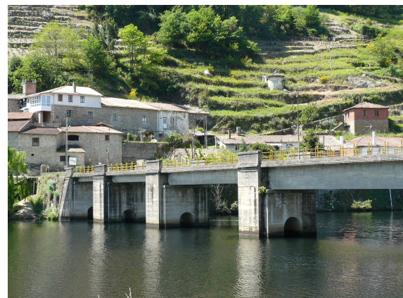
Belesar (casas, pendiente de bajada y puente)

De este descenso que parece no acabarse nunca te das cuenta de su desnivel e inclinación cuando al final llegas al pueblo de Belesar, que siempre se veía abajo, eso si, cuando has tenido tiempo de recuperar la vertical y el aliento. El lugar casi no se puede describir con