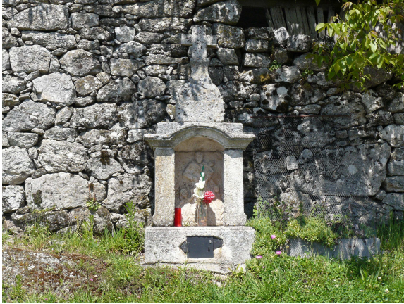
Hornacina de San Antonio

crucero, decidimos parar comer algo y beber agua. Al poco, tras una pequeña subida, iniciamos de nuevo la ruta, que transcurre por una carretera comarcal, de las que apenas tienen tráfico, pero que en muchos tramos los árboles a ambos lados de la carretera hacen el camino bastante agradable. A nuestra izquierda dejamos una construcción rodeada de tapias de piedra que parece uno de esos pazos tan típicos por estas tierras. Un poco mas adelante una hornacina de piedra a pie de carretera, con lo que parece ser un San Antonio, nos vuelve a poner de manifiesto que la devoción a este Santo está bastante arraigada.