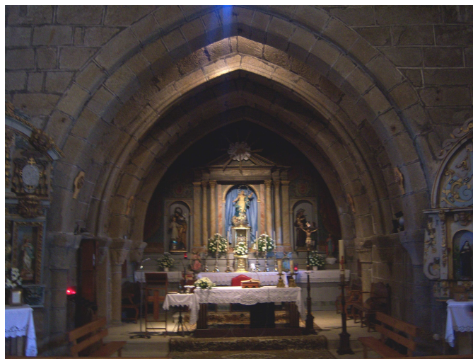
Santa María de Muxía

Cuando terminó su “sinfonía” nos enseñó la iglesia, de otra forma no hubiéramos podido verla pues estaría cerrada. Después de agradecerle el gesto llegamos al santuario de “Nosa S a da Barca”, donde descansamos bastante rato sobre las rocas tomando el sol, pero no pudimos entrar en la iglesia pues hasta las seis y media nos había misa, la vimos por una reja que tiene en la puerta. Cuando nos íbamos llegaba el cura.