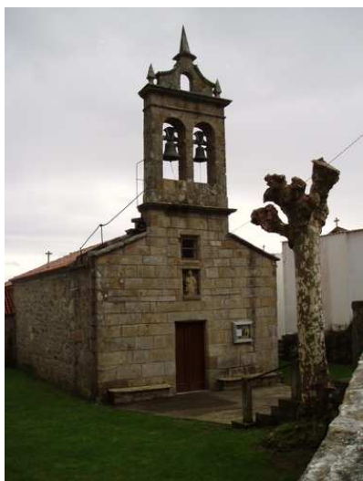
San Martín de Duio

Reckila al haber destruido sus habitantes los templos de la “Herejía Arriana”. Desde aquí se inicia una constante subida en casi todo el tramo arbolada. Tuvimos suerte y dejó de llover, así que hicimos un alto para quitarnos la ropa de agua, reponer fuerzas y beber agua para continuar sin estorbos por la senda que nos llevaría hasta Lires. La hospitalera de Fisterra nos había advertido que deberíamos sellar la credencial en algún lugar de Lires si queríamos obtener la “Muxiana”, pues mucha gente hacía el trayecto en autobús y los de Muxía no se fiaban.