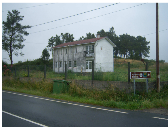
Escuela – albergue de Vilaserío

Cruzamos por alguna pequeña aldea donde en una de ellas me llama la atención un hórreo que está parcialmente cubierto de hiedra, supongo que abandonado aunque parece estar en buen estado, pues hasta ahora los que he visto, están aislados y libres de vegetación. Pronto llegamos a un conjunto de iglesia y cementerio, que esta restaurado y según se indica en una placa de bronce es San Mamede da Pena, parroquia de Piaxe. Continuamos caminando para desembocar en una carretera en la que el “Bar Herminio” nos da la bienvenida. Entramos a sentarnos y tomar bebida y un bocadillo para reponer fuerzas. Allí se encuentran algunos peregrinos de los que nos habían adelantado y otro grupo le los que debieron pernoctar en el albergue.