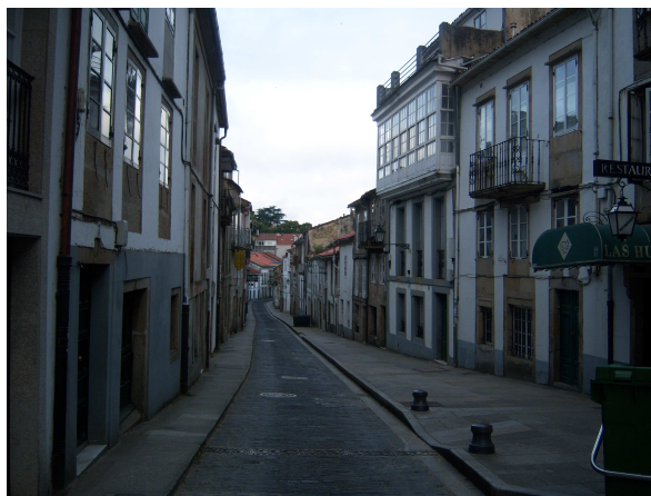
Rúa das Hortas