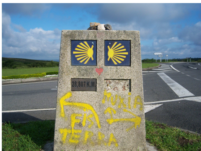
Decisión de Camino