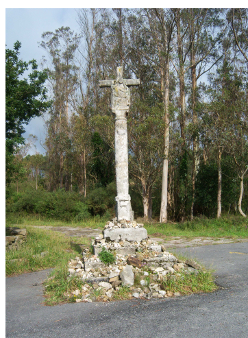
Crucero de “Marco do Couto”

Nosotros lo teníamos claro, nuestro destino era Fisterra, así que hacia la izquierda tomamos lo que fuera el Camino Real que nos lleva a un crucero en el que los peregrinos, como si fuera la