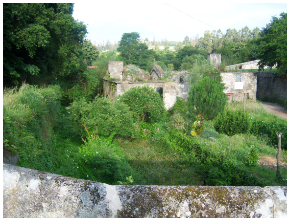
Ruinas de antigua tenería

Cuando llegamos a una zona de hierbas y matorral bajo, a unos treinta metros nos encontramos a un pequeño conejo afanado en triscar hierba que hace caso omiso de nuestra presencia. Poco a poco nos vamos acercando y sigue sin inmutarse, hasta que cuando está prácticamente al alcance de mi bordón, da una pequeña carrerita y se aparta unos diez metros, siguiendo con la misma labor, pasando de nosotros. Desde luego es la primera vez que vemos que un animal campestre esté tan confiado.