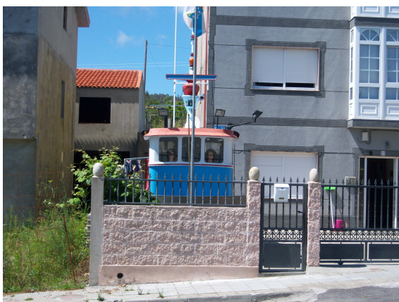
Decoración en Sardiñeiro