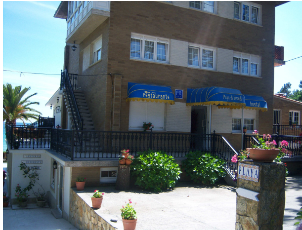
Restaurante en Estorde