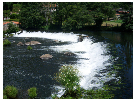
Pontemaceira (Puente y pesquera)