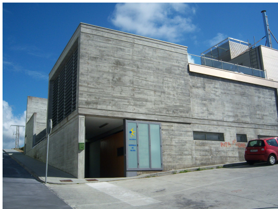
Albergue de Muxía

Volvimos hacia el pueblo siguiendo la carretera del litoral y como cosa curiosa hay que destacar unas empalizadas junto al mar, es un secadero de congrios que todavía está en uso, aunque no hay ninguno en este momento. Vamos directos al albergue, que se encuentra cerca de la entrada del pueblo, así que seguimos caminando. Cuando llegamos nos sorprende su amplitud, su luminosidad y su modernidad, sellamos la credencial, hablamos con el hospitalero y nos dice que la “Muxiana” nos la dan en la Oficina de atención al peregrino.