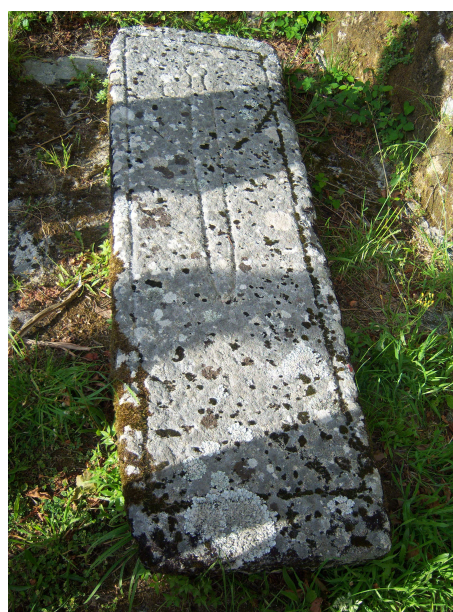
San Xian de Moraima (Iglesia y tumba con espada)