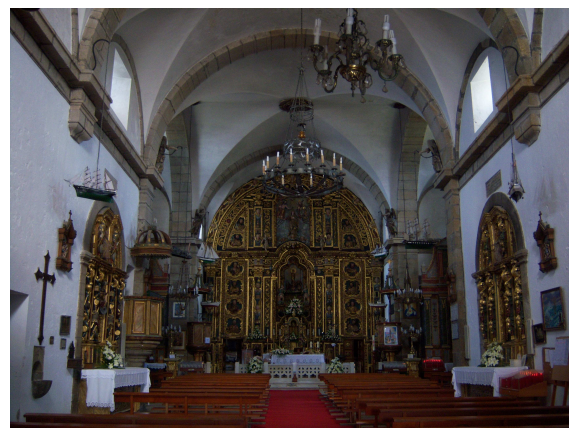
“Nosa S o da Barca” (vista desde arriba e interior)