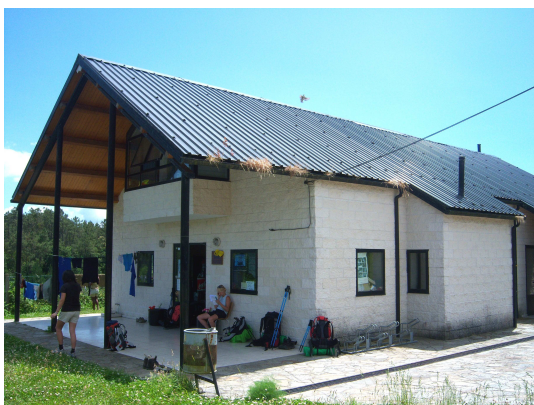
Albergue de Negreira

El pasar por el centro nos muestra lo mas vistoso de la localidad, y como no, aquí también hay un monumento que recuerda la emigración. Cruzamos el puente y enfilamos la subida de una cuesta hacia el albergue. Cuando llegamos los peregrinos que allí están nos comentan que está lleno (en realidad hay una plaza libre). Llamamos por teléfono a la hospitalera y cuando llega nos sella las credenciales y nos dice que el próximo albergue está en Vilaserío, a unos doce kilómetros y que es una antigua escuela con colchonetas en el suelo. También nos dice que puede llamar a un hostel para que como somos cuatro nos cobre un precio razonable (tocamos a 17,50€). Así lo hace y nos vienen a buscar en coche desde el “Hostal Tamara”, que dejamos al inicio del pueblo.