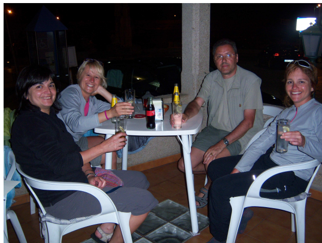
Tertulia antes de dormir

Después de pasar un rato por el conjunto del Faro, donde podemos observar las famosas “vacas” (dos grandes bocinas que a semejanza de un gran mugido de vaca) que avisan a los barcos cuando hay niebla y no se puede distinguir bien la costa. Iniciamos el camino de vuelta, ya que hoy no se puede apreciar la puesta de sol. Poco a poco y cuando unas ligeras gotas empiezan a caer, llegamos al centro y buscamos un lugar para cenar. Encontramos una “Taberna Celta” que nos parece bien y allí picamos una serie de raciones (chorizo, tortilla, pan con tomate, pimientos de Padrón, etc..) que nos sirven de cena.