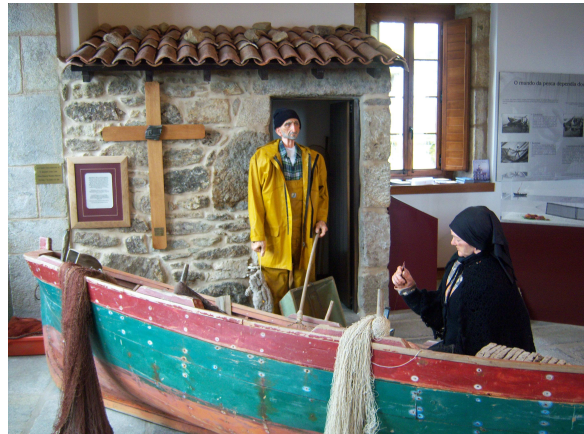
Museo de la pesca