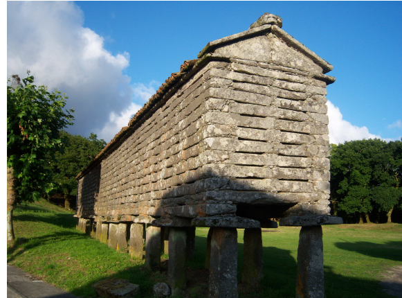
Berdeogas (Castro celta y hórreo)

El otro lugar que quería enseñarnos es un Castro celta que apenas está escavado, pero se adivina su estructura, esta en Berdeogas, antes de llegar a la iglesia de Santiago, así que allí nos encaminamos. Desde luego el castro se encuentra en un lugar idílico, sobre la orilla de un río al que se puede acceder por un paseo. Un poco mas adelante nos sorprende un hórreo muy largo perfectamente conservado y que dadas sus dimensiones debió ser comunal o de la Iglesia, un poco mas adelante la iglesia con una bonita torre y como no un cementerio con unas tumbas bastante curiosas.