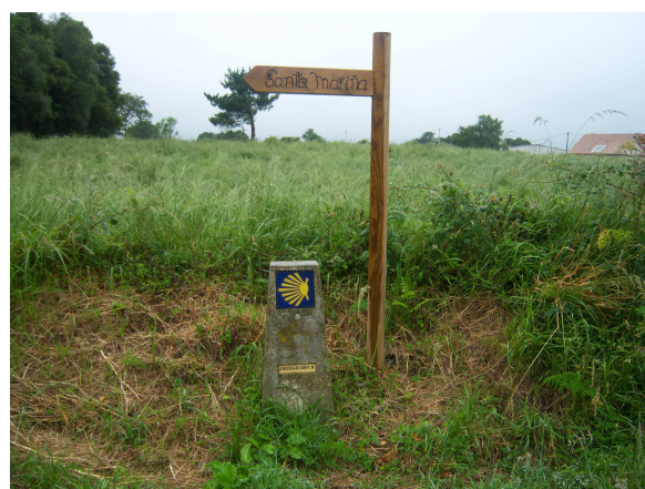
Indicador y mojón

Volvemos de nuevo a la carretera y llegamos a Vilaserío, donde vemos a nuestra derecha la escuela habilitada como albergue que nos había indicado la hospitalera de Negreira, parece un lugar bastante inhóspito y aislado, vamos que no invita nada a quedarse. Algo mas adelante un indicador junto a un mojón nos muestra el camino hacia Santa Marña, a un kilómetro de nuestra ruta, donde según la información que tenemos existe un albergue privado, pero