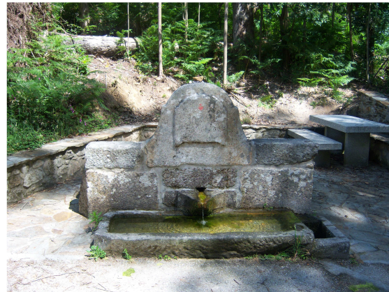
Fuente en el monte