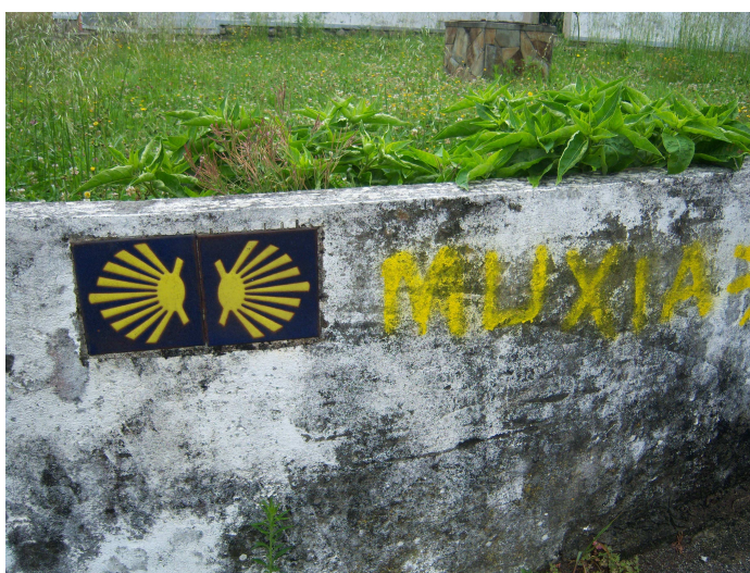
Doble señal en Lires

Al llegar a Lires subimos por las callejuelas hasta la carretera, donde en el bar “As Eiras” paramos unos momentos para sellar la credencial y tomar un “Aquarius”. Como queríamos llegar a nuestro destino a la hora de comer no nos entretuvimos mucho y enseguida volvimos a la ruta. Por suerte el camino era menos duro pues como habíamos comprobado en el perfil de la etapa nos tocaba bajada, aunque contábamos con la dificultad de cruzar el río Castro, pues como nos había indicado la hospitalera no había puente, solo unas anchas piedras, de las que muchas estaban sumergidas con lo que hubo que descalzarse.