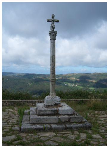
Cruceiro de Armada

En el camino unos metros a la derecha, dejamos a un lado una iglesia, la de San Pedro Martir, allí están paradas un par de peregrinas, pero nosotros seguimos caminando, como vamos por la parte alta del monte, al fondo vemos por primera vez el Cabo de Finisterre. Un poco mas adelante un letrero nos indica que a cien metros está un punto de interés “El Cruceiro de Armada”, aunque es un ligero desvío nos acercamos y aparte de contemplar el cruceiro lo importante es la vista de la costa y sobre todo Finisterre.