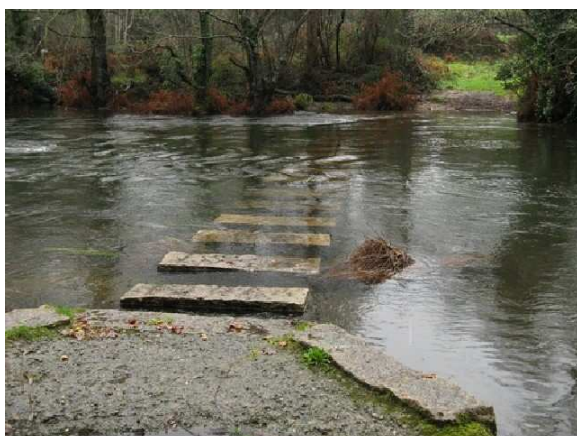
Piedras del río Castro

Al llegar a Lires subimos por las callejuelas hasta la carretera, donde en el bar “As Eiras” paramos unos momentos para sellar la credencial y tomar un “Aquarius”. Como queríamos llegar a nuestro destino a la hora de comer no nos entretuvimos mucho y enseguida volvimos a la ruta. Por suerte el camino era menos duro pues como habíamos comprobado en el perfil de la etapa nos tocaba bajada, aunque contábamos con la dificultad de cruzar el río Castro, pues como nos había indicado la hospitalera no había puente, solo unas anchas piedras, de las que muchas estaban sumergidas con lo que hubo que descalzarse.