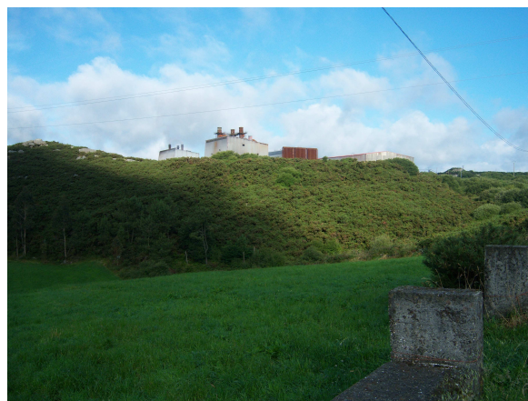
Industria en el monte