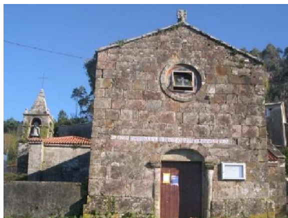
Iglesia de Morquitan

La hospitalera también nos había indicado que era mejor cruzarlo con calcetines pues las piedras podían resbalar, pero como no estábamos por la labor de llevar ropa mojada