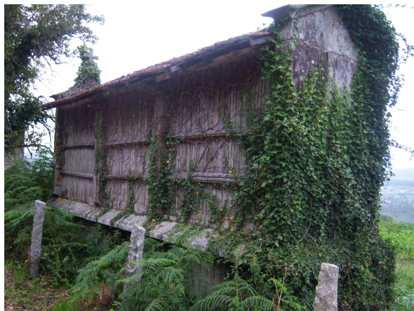
Hórreo con hiedra

El camino transcurre por el antiguo Camino Real, entre árboles y pronto dejamos de ver a nuestras compañeras, aunque aparecen otros peregrinos extranjeros (parece que llevan la bandera de Australia en la mochila) que nos adelantan a buen ritmo. Aunque hace bastante tiempo que la humedad está presente, ahora parece que las gotas son mas gruesas y poco a poco van calando, con lo que decidimos ponernos los chubasqueros y continuar el camino.