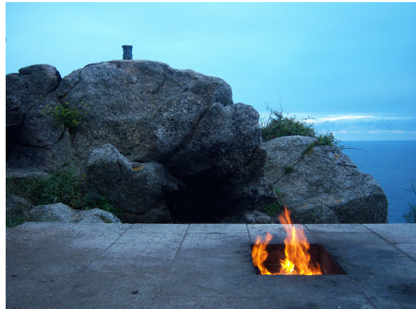
Fuego ante el mar

Después de pasar un rato por el conjunto del Faro, donde podemos observar las famosas “vacas” (dos grandes bocinas que a semejanza de un gran mugido de vaca) que avisan a los barcos cuando hay niebla y no se puede distinguir bien la costa. Iniciamos el camino de vuelta, ya que hoy no se puede apreciar la puesta de sol. Poco a poco y cuando unas ligeras gotas empiezan a caer, llegamos al centro y buscamos un lugar para cenar. Encontramos una “Taberna Celta” que nos parece bien y allí picamos una serie de raciones (chorizo, tortilla, pan con tomate, pimientos de Padrón, etc..) que nos sirven de cena.