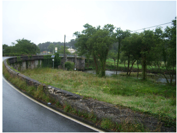
Camino a Ponteolveira

Continuamos por la carretera y a poco mas de un kilómetro encontramos Ponteolveira, por cuyo puente cruzamos el río Xallas, que según nuestra hoja de ruta es el último obstáculo que nos separa de Oliveiroa, nuestro punto de destino, al que a unos dos kilómetros llegamos sin mayor novedad.