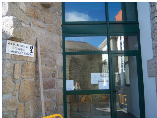
Oficina de atención al peregrino