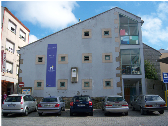
Albergue de Fisterra

Bajamos hasta el nivel del mar y por una senda de losetas de piedra, bordeada de fuentes que aunque apretamos los grifos no sale agua recorremos a lo largo la playa de Langosteira, pasamos por la zona que tiene los bares y comercios típicos de la zona playera y tras subir una cuesta llegamos a un cruce que parece marcar el final de la playa, pues inmediatamente entramos en las calles del pueblo. Pasamos por delante del ayuntamiento y en una plaza al final de la calle encontramos el albergue de peregrinos.