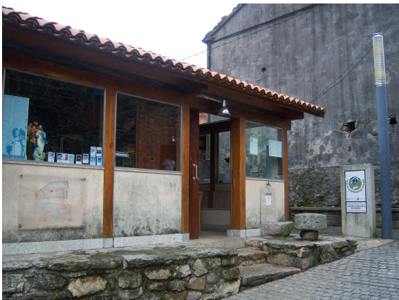
Recepción del albergue