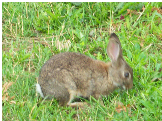
Conejo en la hierba

Cuando llegamos a una zona de hierbas y matorral bajo, a unos treinta metros nos encontramos a un pequeño conejo afanado en triscar hierba que hace caso omiso de nuestra presencia. Poco a poco nos vamos acercando y sigue sin inmutarse, hasta que cuando está prácticamente al alcance de mi bordón, da una pequeña carrerita y se aparta unos diez metros, siguiendo con la misma labor, pasando de nosotros. Desde luego es la primera vez que vemos que un animal campestre esté tan confiado.