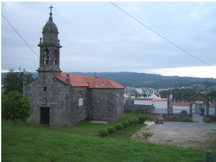
Iglesia de San Xian

Como nos habíamos acostado pronto, levantarnos temprano no supuso ningún problema, así que antes de las siete estábamos frente a la puerta del bar, esperando su apertura. Cuando abrieron, procedimos a desayunar café con leche y tostadas de pan del país que enseguida nos dieron la energía necesaria para partir. Atravesamos todo el pueblo e iniciamos la subida de la cuesta que lleva al albergue, donde antes de llegar está la indicación de girar a la derecha para retomar el Camino. Pasamos por delante de la iglesia de San Xian, donde si miramos hacia el fondo, se observa el valle que acabamos de dejar. Atravesamos una serie de casas hasta que tomamos una vieja carretera que nos lleva hasta Zas, una pequeña aldea en la que una solitaria columna de piedra tiene incrustada una vieira que indica la dirección.