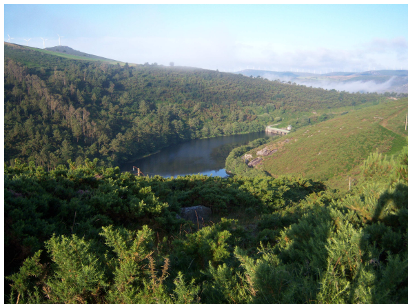
Embalse de Oliveira

dentro del cuerpo, rellenó el impreso con una queja sobre el horario de cierre y el ruido molesto para los vecinos, desde luego hace falta sangre fría para aguantar el tipo en estas circunstancias. Cuando nos lo contó no dábamos crédito y empezamos a entender lo que la decían cuando caminábamos en grupo, ya con nuestras mochilas para desayunar en el bar donde habíamos cenado, que además estaba en el camino de salida hacia Finisterre.