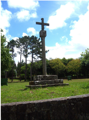
Cruceiro en Corcubión

el cementerio, que también se encuentra integrado en el entorno. Ya en el centro caminamos por sus calles, pasamos por delante de una iglesia, el ayuntamiento, cruzamos la ría, pasamos por delante del hospital e iniciamos una subida que nos llevará a pasar Corcubión por el monte, así que salvo desde arriba a eso se redujo nuestro paso por esta localidad. Nos refrescamos con el agua de una fuente junto a un lavadero, pues la subida había puesto en prueba nuestras piernas y resuello.