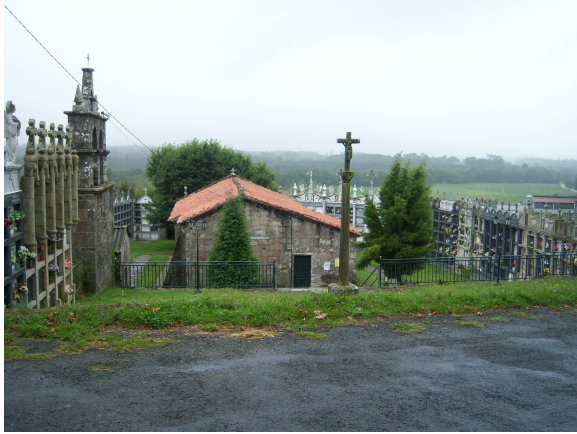
Iglesia y cementerio de Corzón

nosotros seguimos sin desviarnos hasta llegar a la aldea de Bon Xesús, donde nos recibe un cruceiro con un pequeño altar. Parece que no, pero estamos en una subida constante hasta que iniciamos el descenso que siguiendo la carretera nos lleva hasta Corzón. Allí encontramos un conjunto sorprendente, donde un cruceiro preside la entrada a una iglesia rodeada de un cementerio y con el campanario separado de la misma. Desde luego los cementerios en Galicia son una parte totalmente integrada en el paisaje.