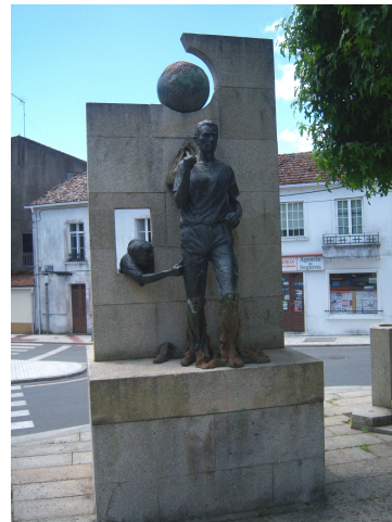
Negreira (Paseo y monumento al emigrante)

El pasar por el centro nos muestra lo mas vistoso de la localidad, y como no, aquí también hay un monumento que recuerda la emigración. Cruzamos el puente y enfilamos la subida de una cuesta hacia el albergue. Cuando llegamos los peregrinos que allí están nos comentan que está lleno (en realidad hay una plaza libre). Llamamos por teléfono a la hospitalera y cuando llega nos sella las credenciales y nos dice que el próximo albergue está en Vilaserío, a unos doce kilómetros y que es una antigua escuela con colchonetas en el suelo. También nos dice que puede llamar a un hostel para que como somos cuatro nos cobre un precio razonable (tocamos a 17,50€). Así lo hace y nos vienen a buscar en coche desde el “Hostal Tamara”, que dejamos al inicio del pueblo.