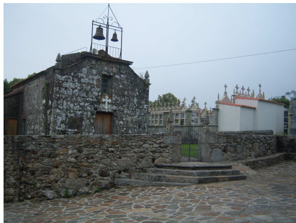
San Mamede da Pena

Cruzamos por alguna pequeña aldea donde en una de ellas me llama la atención un hórreo que está parcialmente cubierto de hiedra, supongo que abandonado aunque parece estar en buen estado, pues hasta ahora los que he visto, están aislados y libres de vegetación. Pronto llegamos a un conjunto de iglesia y cementerio, que esta restaurado y según se indica en una placa de bronce es San Mamede da Pena, parroquia de Piaxe. Continuamos caminando para desembocar en una carretera en la que el “Bar Herminio” nos da la bienvenida. Entramos a sentarnos y tomar bebida y un bocadillo para reponer fuerzas. Allí se encuentran algunos peregrinos de los que nos habían adelantado y otro grupo le los que debieron pernoctar en el albergue.